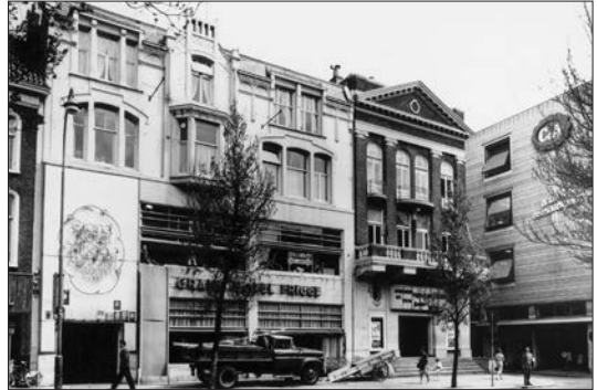
Afb. 2. De situatie vóór 1970, van links naar rechts: Hotel Frigge, Bioscoop Luxor, ingang Burchtstraat en C & A, 1967.

Rond de Tweede Wereldoorlog was het complex Frigge-Luxor welhaast het stralende middelpunt van uitgaand Groningen. Van heinde en ver kwam men om op zondagmiddagen te dansen in het hotel of om er op verschillende avonden door de week allerlei soorten van entertainment bij te wonen. In de Luxor-bioscoop vonden de Groninger premières plaats van films als ‘Gone with the wind’ en ‘Et Dieu créa la femme’. Kinderen uit de Herestraat en de Burchtstraat speelden op verlaten zondagochtenden op de vooruitstekende trappen van Luxor, terwijl volwassenen een kopje koffie dronken op het terras van Frigge (afb. 2).