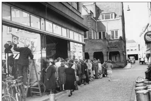
Afb. 3. C & A ruimt op, ingang C & A met doorkijk naar de Herestraat, 1951.

Zuiderdiep' – ir. H.J. Dix aan de directie van C & A dat er tegen het plan ernstige bedenkingen bestonden daar het in strijd was met de bouwverordening. “Ik moge U derhalve verzoeken mij op korte termijn te berichten of dit plan eventueel in overleg met mijn dienst zal worden gewijzigd, omdat ik anders genoodzaakt zal zijn het College van Burgemeester en Wethouders afwijzend over dit bouwplan te adviseren” 4 .