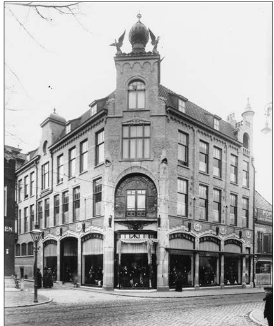
Afb. 1. Mantelmagazijn De Adelaar in 1916, de latere vestiging van C & A.