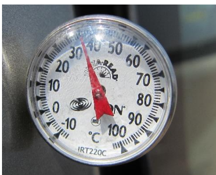
De temperatuur in de auto wordt gemeten met een autothermometer, deze geeft 37°C aan en loopt nog op.