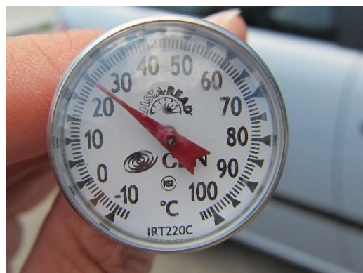
De thermometer geeft een buitentemperatuur van 25 °C aan.

Door de ramen van de auto beoordelen we de toestand van het dier, in dit geval een hond.