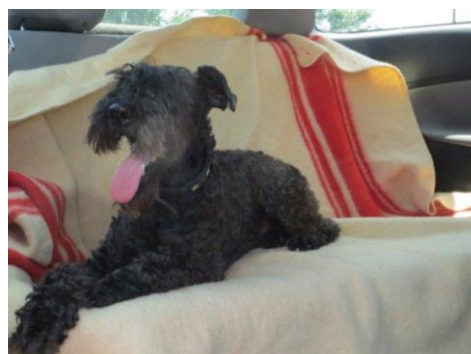
We tikken even tegen het raam om te kijken of de hond nog reageert. De hond komt versuft omhoog en begint gelijk flink te hijgen en te kwijlen