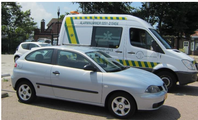
Deze auto met daarin een hond staat in de volle zon met de ramen volledig gesloten.

Ter plaatse registreren we hoe we het voertuig aantreffen en welke handelingen we verrichten. Het belang van het dier blijft uiteraard op de eerste plaats staan. Aangezien we meestal met zijn tweeën zijn, worden de taken verdeeld.