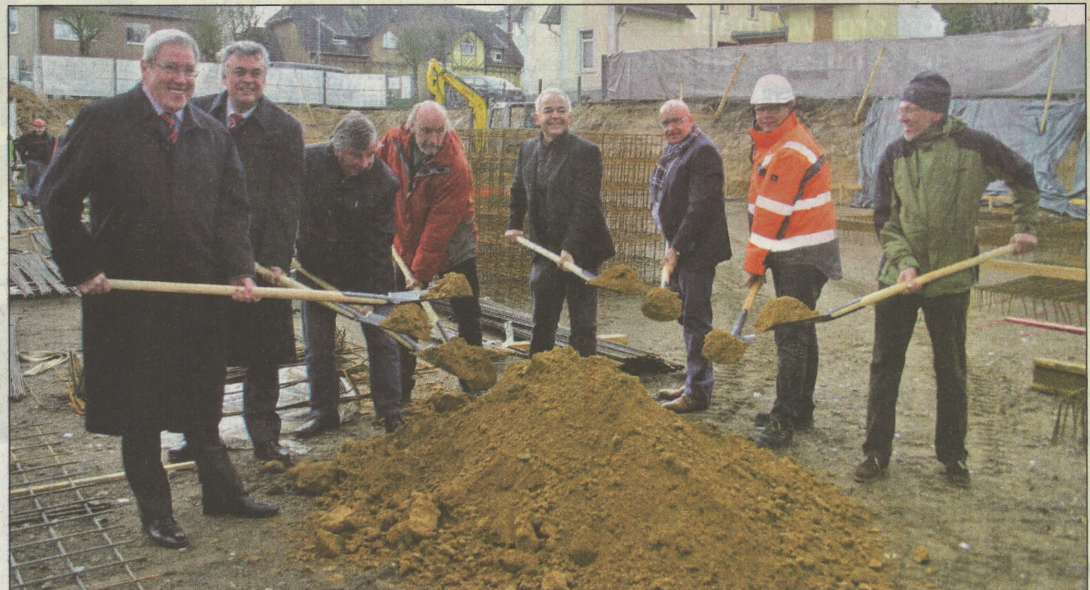
Der erste Spatenstich zum Neubau fand im November letzten Jahres auf dem geschichtsträchtigen Gelände des ehemaligen Anton-Raky-Hauses statt.

waren auch Mitglied im Stadtrat, den „Bauverein“, um unbemittelten Familien Wohnungen in eigens erbauten Häusern zu niedrigen Preisen zu verschaffen. Bis 1906 wurden 44 Häuser fertiggestellt. Die Arbeitersiedlung nannte sich im Volksmund „Kairo“. Die Herkunft dieses Namens ist nicht zu klären, vermutlich stand aber die für