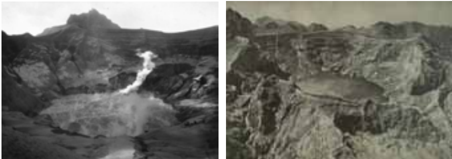
Gambar 1 & 2: Kawah Puncak Gunungapi Kelut setelah meletus pada tahun 1901 dan suasana kawah Puncak Gunungapi Kelut pada tahun 1922. Tampak dinding tebing di bagian selatan menganga setelah longsor pada peristiwa letusan pada tanggal 20 Mei 1919..

Banjir lahar tersebut terjadi karena meluapnya air danau kawah di puncak Gunungapi Kelut yang disebabkan oleh terdesaknya massa air di danau kawah tersebut oleh material tebing puncak Gunungapi Kelut yang runtuh dan material runtuhannya masuk ke dalam danau kawah, menimpa air danau sehingga airnya meluap membanjir menerjang sisi tebing yang menganga tak berinding. Oleh karena tebing puncak Gunungapi Kelut yang runtuh pada sisi selatan, maka otomatis luapan air danau kawah Gunungapi Kelut meluap ke arah selatan. Selanjutnya terjadilah banjir lahar panas selebar 5 pal ( \pm 7.530 m), mengarah ke Abdeling Blitar yang berada di sebelah selatan Gunungapi Kelut.