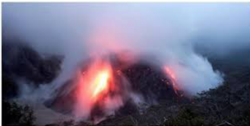
Gambar 7: Letusan Gunungapi Kelut membuat air danau mendidih tahun 2007.

Usahakan danau Gunungapi tersebut tidak mendapatkan tambahan air, oleh karena itu harus dibuatkan saluran pembuangan air yang kuat dan tidak mudah rusak.