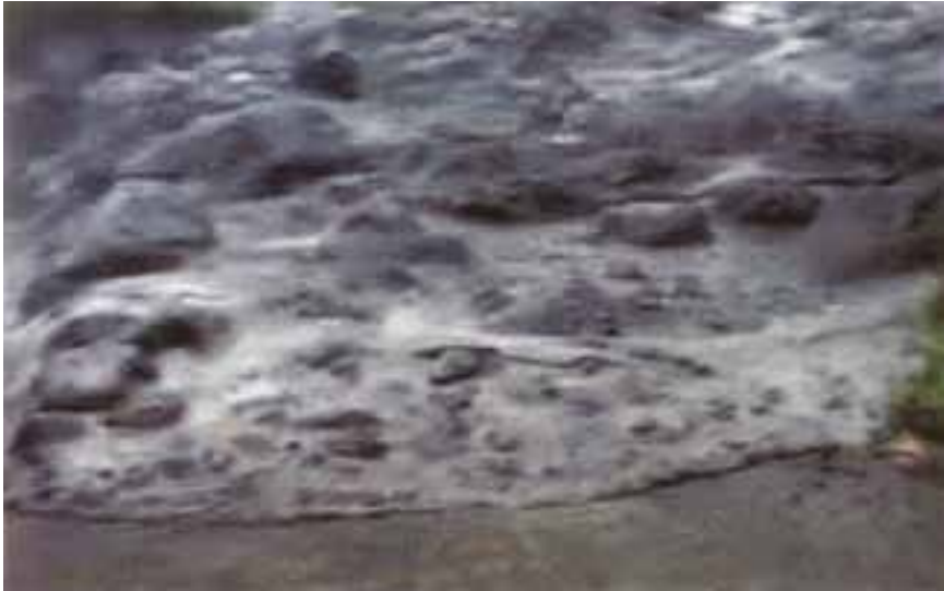
Gambar 8: Leleran lahar panas menyapu apapun yang dilewatinya.

Dengan pernyataan tersebut, penulis naskah memberi solusi bahwa agar tidak terjadi banjir lahar panas yang menakutkan karena menimbulkan banyak kematian dan kerusakan, maka satu-satunya jalan agar danau di puncak atau kawah Gunungapi Kelut tersebut harus kering atau diupayakan air hujan tidak menggenangi kawah. Untuk itu maka air tersebut harus dapat mengalir, sehingga kawah tetap kering. Hal tersebut perlu pemikiran bagaimana mengupayakannya. Informasi solusi ini tentu saja sangat baik dan masuk akal, dalam membuka kesadarannya sehingga akan memicu atau mendorong partisipasi masyarakat dalam penanganan ini.