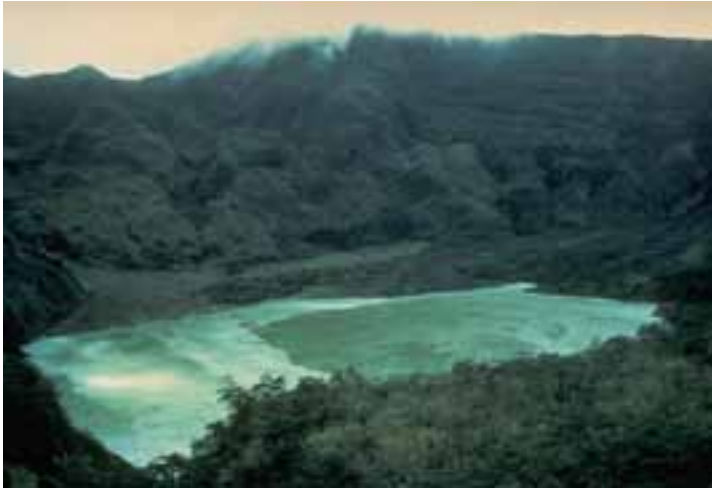
Gambar 4: Pesona keindahan alam Kawah Puncak Gunungapi Kelut tahun 1980 ( http://landslides.usgs.gov )

Gunung Kelut merupakan salah satu Gunungapi berdanau kawah yang sangat aktif. Puncak gunung yang berdanau memang terlihat indah namun disisi lain sangat berbahaya pada saat meletus. Hal ini karena keberadaan kawah dapat menimbulkan banjir lahar. Pada saat meletus kawah ini bercampur lahar menjadi mendidih dan terlempar serta meleleh ke bawah menjadi banjir lahar panas, menerjang apa saja yang dilalui. Adapun lahar adalah tumpahan air danau kawah karena proses erupsi. Tumpahan air danau kawah ini dalam keadaan normal akan melewati sungai yang berhulu dipuncak Gunungapi Kelut. Namun dalam keadaan tidak normal, misal erupsi terlalu besar seperti tenaga endogen (tenaga dari dalam magma) nya atau erupsi yang disertai dengan runtuhnya tebing-tebing kawah, maka air danau kawah tersebut akan mengalir tidak seperti biasa. Tumpahan air kawah mendidih yang tercampur lahar panas ini akan berbentuk larutan yang agak encer dan akan tumpah melalui dinding kawah yang rendah atau yang runtuh ataupun hulu sungai yang bermuara di bagian puncak gunung yang biasa dilalui tumpahan lahar.