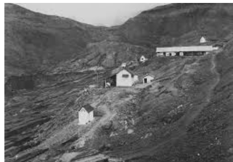
Gambar 3 & 4: Kondisi lahar dan bekas aliran lahar letusan Gunungapi Kelut tanggal 20 Mei 1919.

Ketika itu, suasana di Kota Blitar sangat mengerikan. Dalam gelap gulita terdengar hiruk pikuk suara orang berteriak menjerit minta tolong saling bersautan yang akhirnya senyap tak terdengar, tertutup oleh derasnya suara deru gemuruh dan gelegak membanjirnya air lahar panas yang menghancurkan apapun yang diterjangnya. Suara gemeretak dan dentuman robohnya berbagai bangunan maupun pepohonan besar