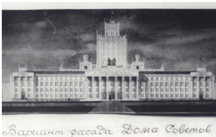
Рис. 1 «Вариант фасада Дома Советов. Из материалов архитектора Калимуллина»