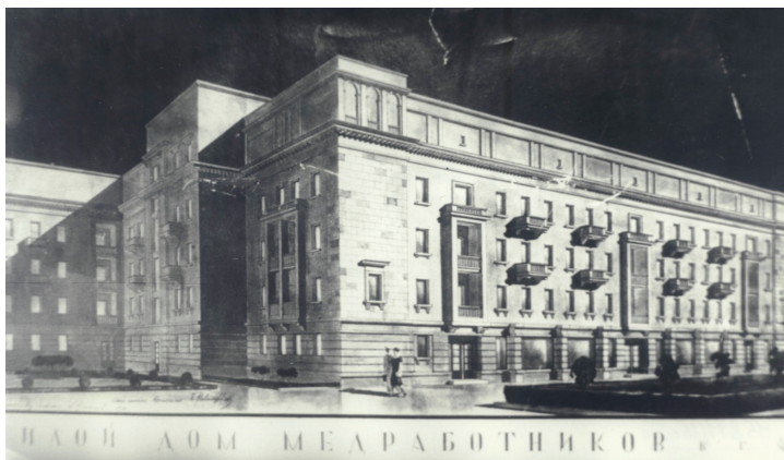
Рис.4 «Жилой дом медработников»

Помимо правительственных и административных зданий, Б.Г. Калимуллин занимался проектированием жилых домов. После возведения Дома специалистов в Уфе по адресу улица Ленина, 2, в апреле 1936 года Совнарком БАССР принял постановление о строительстве второго дома специалистов на улице К. Маркса, 32. За последним закрепилось название – Дом медиков и актеров [5]. Боковые фасады трех корпусов, обращенные к будущему Дворцу социалистической культуры (ныне Дом профсоюзов ул. Кирова, 1) имели признаки классической традиции: балюсы небольших балкончиков, пилястры, рустовка цокольного этажа, скульптуры (не реализованы). Дом медиков и актеров был введен в эксплуатацию в 1939 году. Стилистически он послужил прототипом для послевоенной градостроительной практики Уфы и Черниковска.