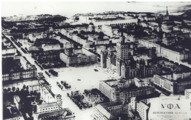
Рис. 2 «Перспектива центра южной части Уфы. Из материалов архитекторов Калимуллина»

Снимок представляет будущий Дом Советов в пространственном объеме с главной городской площадью [3], которую в довоенной Уфе предполагалось организовать в квартале, образуемом старинными каменными лавками Гостиного двора. Будущее здание Дома Советов, оформлявшее площадь, должно было иметь два парадных фасада. Одно из них выходило на площадь перед улицей Ленина, другое было обращено к улице Карла Маркса. Начавшаяся вскоре Великая Отечественная война и размещение в помещениях Гостиного двора эвакуированных Ярцевской прядильной (Смоленская область) и Серпуховской ткацкой (Московская область) фабрик, сняла вопрос о реализации этого проекта.