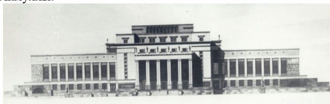
Рис. 3 «Дипломный проект административного здания. 1935 г.»

В этом же ряду стоит еще одно детище Б.Г. Калимуллина – здание Наркомата промышленности (ул. Октябрьской революции, 3а). В стенах памятника постконструктивизма 1936-1937 гг. ныне разместились институты Башкирского государственного педагогического университета им. М. Акмуллы.