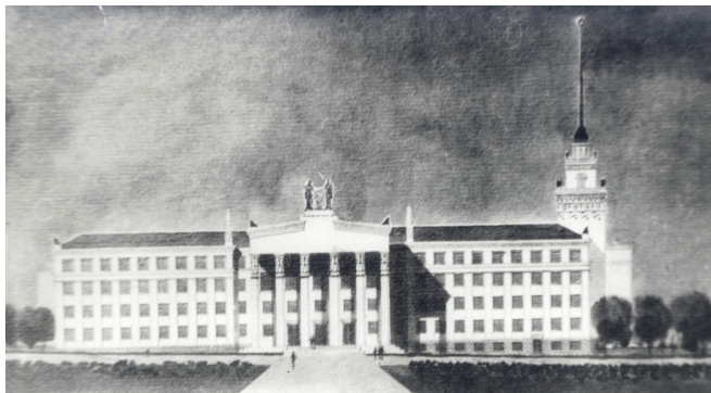
Рис.5 «Вариант фасада Башгосуниверситета»