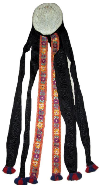
Рис. 4. Обрядовий чепець, с. Рекіти Міжгірського району. Гачковане мереживо, фабричні стрічки. Початок ХХ ст.