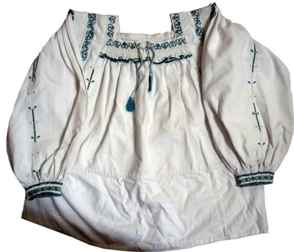
Рис 3. Жіноча сорочка, с. Солотвино Тячівського району. Домоткане полотно, вишивка, низина. 30-ті роки XX ст.

Для вивчення традиційного народного вбрання не менш важливим є з'ясування його функціонального призначення. Тут можемо простежити таку лінію: буденний одяг – простий, святковий – пишно декорований, обрядовий – символічний. Одяг є яскравим виразником повсякденного побуту, святкової урочистості та обрядової символічності. Використання різних елементів народного вбрання у родинній обрядовості вказує на тісний зв'язок матеріальної і духовної культури . Прикладами суто обрядового вбрання на Закарпатті є такі його складові як гуцульська сукняна спідниця (“літник”, “сукня з огальоном”), широкий тканий жіночий весільний пояс у тересвянських долинян, чепець у бойків та дівочий головний убір (велике біле полотнище (“білило”)) у бойків і лемків Закарпаття, весільні барвінкові вінки. Серед них можемо виділити бойківський чепець та гуцульську спідницю.