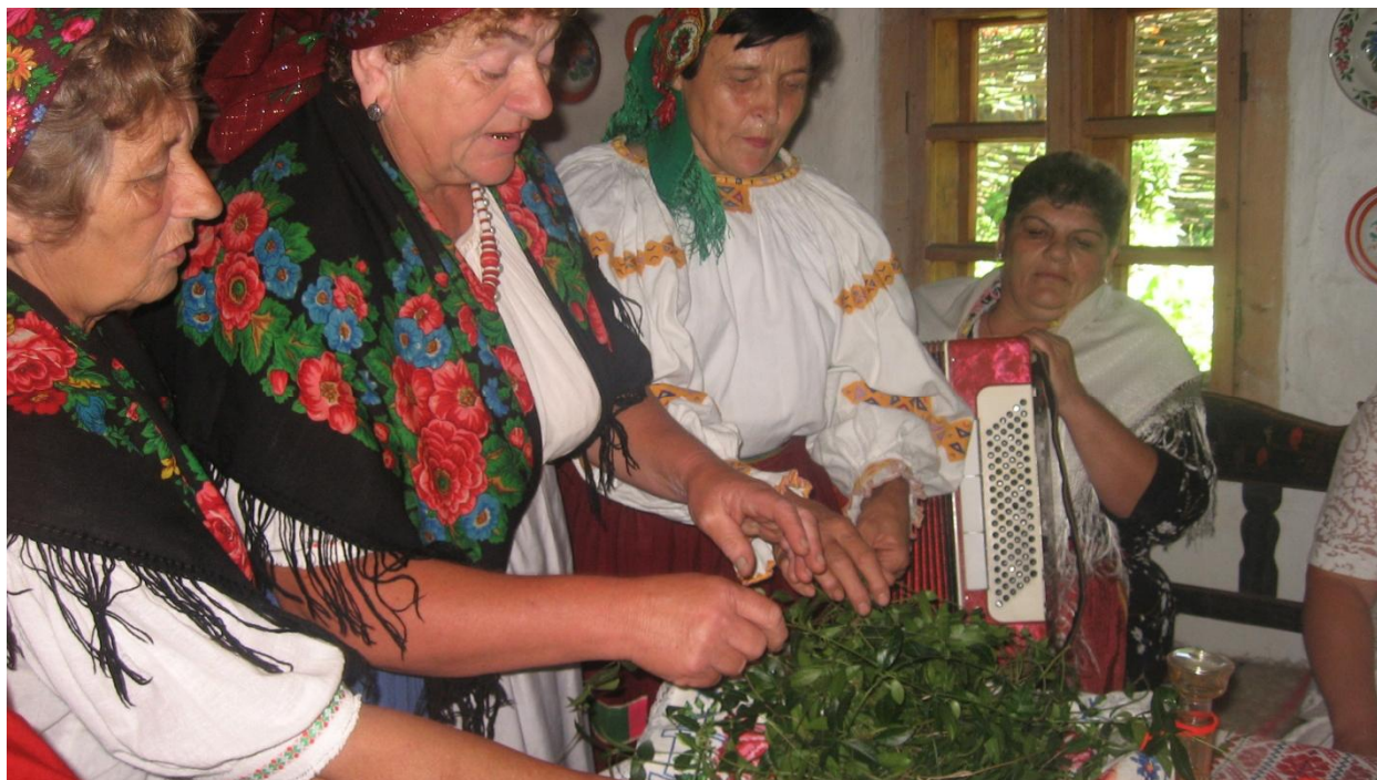
Рис. 6. Плетіння весільних барвінкових вінків. Фрагмент традиційного народного весілля в ужгородському скансені, 2008 р..

Дослідження традиційного одягу дають змогу через виставкову роботу фрагментарно відтворювати традиції проведення свят річного календарного циклу (Різдва, Стрітєння, Великодня, Покрови тощо). Останніми роками доброю традицією стали щорічні виставки, присвячені одному із найбільших релігійних свят – Великодню. Тематико-експозиційний план виставок щороку доповнюється, удосконалюється. Але обов'язковим завжди є використання комплектів або окремих складових традиційного вбрання українців Закарпаття. У 2011 р. у виставковому залі працівники музею відтворили давню селянську хату, ошатно прибрану до Великодніх свят. На стінах висять ікони і тарілки, на жердині розвішені декоративні грядкові рушники, на столі – кошик із щойно освяченою паскою та неодмінні атрибути Великодня – писанки. Привертає увагу лавиця, біля якої зручно примостилися маленькі хлопчик і дівчинка, радісно забавляючись із писанками. Окрім цього, символічна сільська громада, яка складається з представників різних куточків Закарпаття, ніби завмерла, очікуючи на освячення пасок священником [33, с. 12].