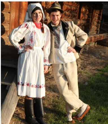
Рис. 7. Молода пара в традиційному народному вбранні, с. Гукливий Воловецького району. Реконструкція, 2014 р. (Фото з архіву автора)

Для проведення реконструкції відібрано 16 одягових комплексів, які представляли як всі адміністративні райони краю, так і всі етнографічні групи українців Закарпаття, а також одягові традиції угорців і румунів краю. За якихось 15–20 хвилин сучасна молодь “перевтілилась”, вдало ввійшовши в роль гуцулів, бойків, лемків і долинян. Первинна скромність та замкнутість студентів швидко змінилися на емоції, радість, гордість за традиції своїх дідів-прадідів. Більшість з студентів прагнули одягнути народне вбрання рідного району. Відповідний настрій значно полегшив роботу фотографу-професіоналу Ярославу Макару (рис. 7, 8).