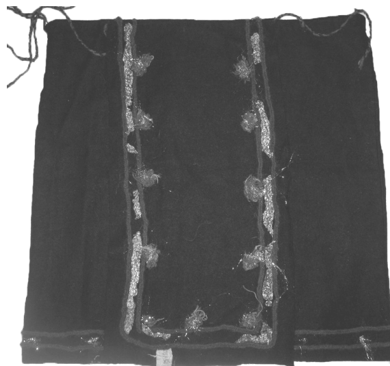
Рис. 5. Весільна сукня, с. Ясіня Рахівського району. Чорне сукно, фабричні стрічки. 20–40-ві рр. ХХ ст.

Разом із науковим дослідженням традиційне народне вбрання є важливим джерелом для популяризації культурної спадщини нашого краю. Різноманітні аспекти популяризації традиційного народного вбрання краю можна поділити на дві основні групи: статичні та атракційні.