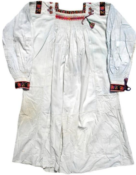
Рис 2. Жіноча сорочка, с. Дубове Тячівського району. Домоткане полотно, вишивка, низина, хрестик. 20-ті роки XX ст.