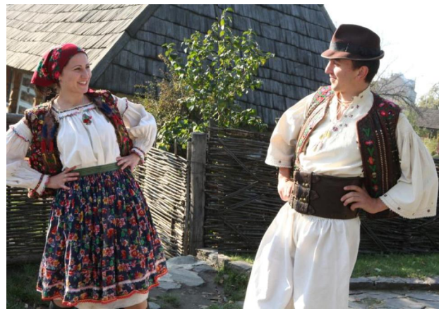
Рис. 8. Молода пара в традиційному народному вбранні, с. Бедевля Тячівського району. Реконструкція, 2014 р.

Зусилля багатьох людей втілились у виданні набору листівок “Традиційний одяг та вишивка Закарпаття”. Проект реалізувала Тетяна Сологуб-Коцан після закінчення двох сесій семінарської програми “Презентаційна продукція та промоція музею” (вересень 2014 р., м. Київ). Програма виконувалася в межах проекту “ProMuseum: Розвиток ресурсної бази та модернізація музейної галузі” ГО “Український центр розвитку музейної справи” за фінансової підтримки МФ “Відродження” та МБФ “Україна 3000”.