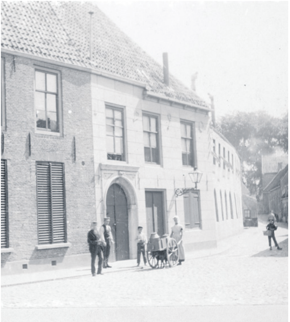
▲ De gevel van het Gasthuis in de Gasthuisstraat, met daarin resten van de vroegere kapel van het Gasthuis. Ca.1900.