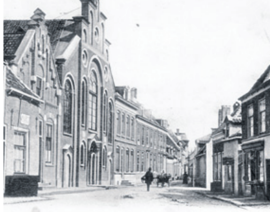
▲ De Gereformeerde Kerk aan de Wijngaardstraat, vanaf de Koepoort gezien, ca. 1900.

Waar nu de voorsorteerstroken naar de Westwal zijn, loofden de gereformeerden van 1841-1930 de Heer. In 1836 scheidde een groot aantal leden van de Hervormde Kerk zich af en vormden de Christelijke Afgescheiden Gereformeerde Kerk, zoals de naam toen was. In 1841 kochten zij de zeepziederij De Weerelt, die al in de zeventiende eeuw bekend stond als brouwerij. Ze verbouwden het pand tot kerk; in 1877 werd een orgel geplaatst. Toen de gemeente het pand in 1930 verliet en de Westerkerk betrok, werd het een garage. Bij de bevrijding van Goes in oktober 1944 liep het grote schade op en in het begin van de jaren vijftig werden de resten gesloopt. Het is nog slechts bekend van foto's en ansichten. Het orgel uit de oude kerk, met zestien sprekende stemmen, bestaat nog. Het werd te klein bevonden voor de nieuwe kerk. De bouwer van het orgel in de nieuwe kerk, Orgelfabriek Dekker uit Goes, nam het over en herplaatste het instrument, dat al 110 jaar oud was en oorspronkelijk in de kerk van Tzummarum heeft gestaan, in de Hervormde kerk van Wierum. Daar staat het nu nog.