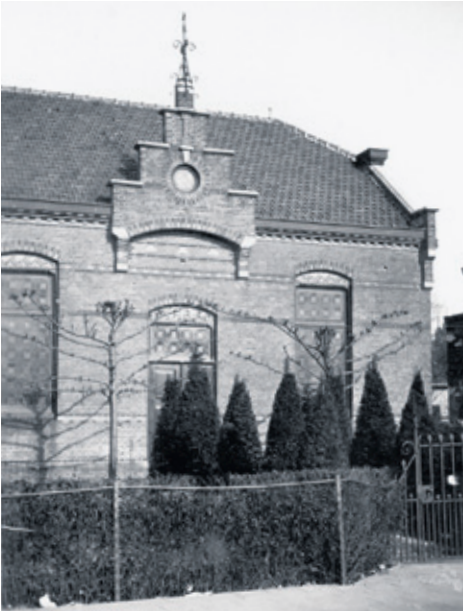
^ Het in 1934 afgebroken Doopsgezinde kerkje.