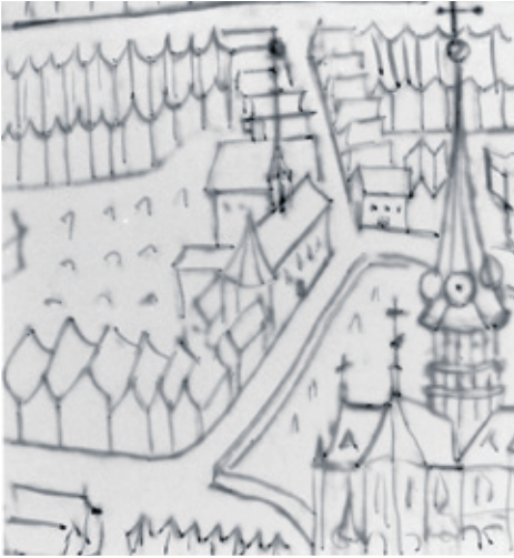
Detail uit de tekening van Goes door Jacob Reijnoutssen, met een beeld van de Singelstraat met Grote Kerk en Waalse Kerk, ca. 1650.