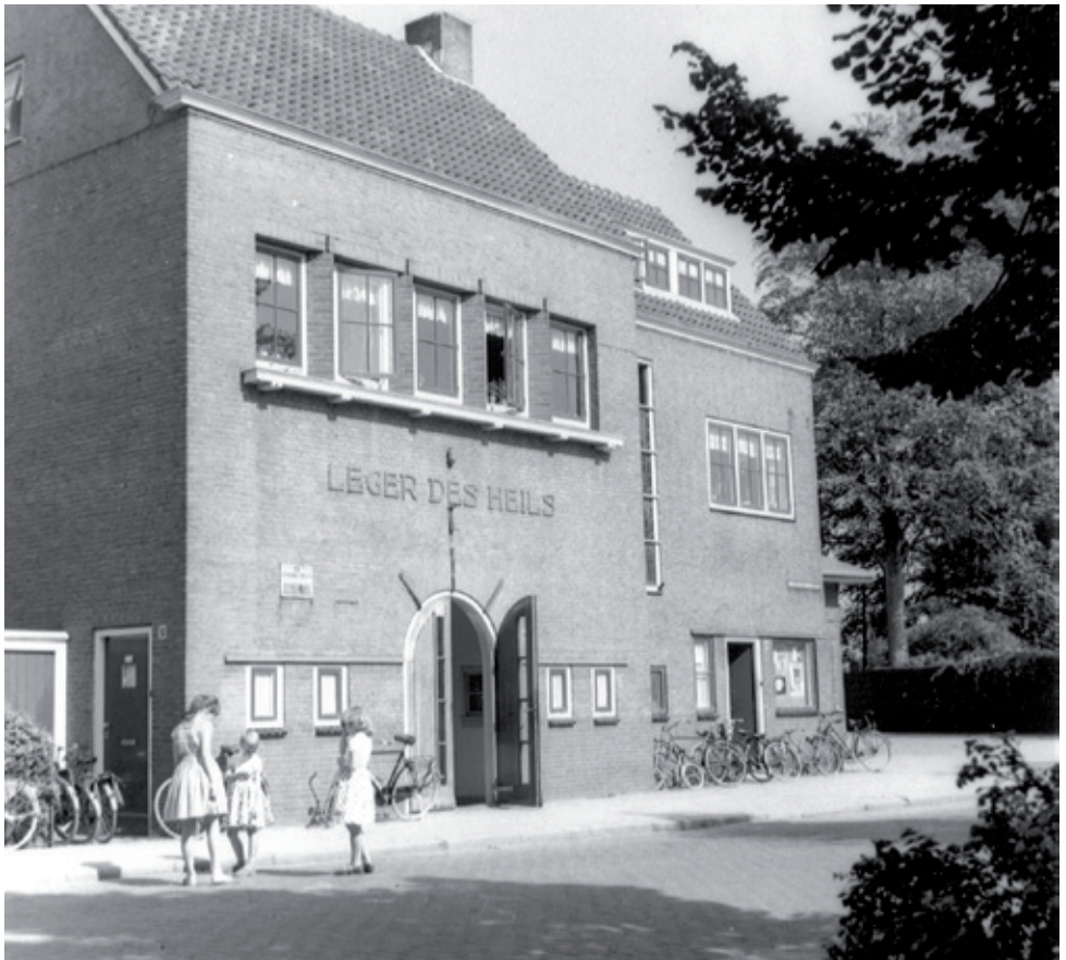
^ Gebouw van het Leger des Heils, gebouwd in 1934, foto 1955