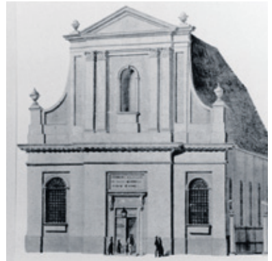
▲ Tekening van de Waterstaatskerk aan de Singelstraat, afgebroken in 1906.

In de tijd van het Koninkrijk Holland (1806-1810) kwamen de katholieken uit hun schuilkerk en kregen in eerste instantie de beschikking over de Kleine Kerk (waarover later meer). In 1815 namen zij op het terrein waar nu de pastorie staat, een waterstaatskerk in gebruik. Dat gebouw verdween bij de bouw van de huidige kerk. In 1907 nam de r.k. parochie van Goes deze in gebruik. De voorgevel geeft een staaltje van fijnzinnige humor, waarin de katholieke emancipatie nadrukkelijk tot uiting komt. In de gevel staat de tekst: Hic est Domus Dei et Porta Coeli (dit is het huis van God en de poort naar de hemel). Daar konden de hervormden van de Grote Kerk het mee doen. Een vorm van gerechtigheid? Wellicht, de Grote Kerk was vóór 1578, toen in Goes de Reformatie doorbrak, immers een katholieke kerk. Zo zal het ook niet geheel toevallig zijn dat de nieuwe kerk recht tegenover de oude kerk gebouwd werd.