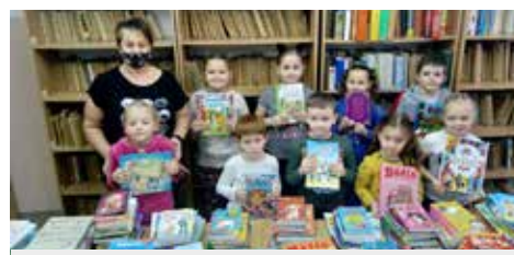
SP Dąbrówka Starzeńska