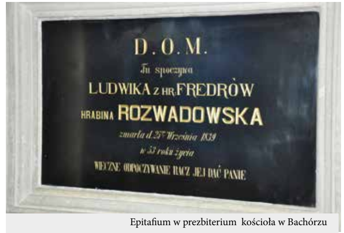
Epitafium w prezbiterium kościoła w Bachórzezu

Na kilka miesięcy przed zgonem odezwała się w niej silniej niż kiedykolwiek tęsknota do życia zakonnego, w którym ufała, że więcej będzie mogła zbliżyć się do Boga, i zupełnie niż do-