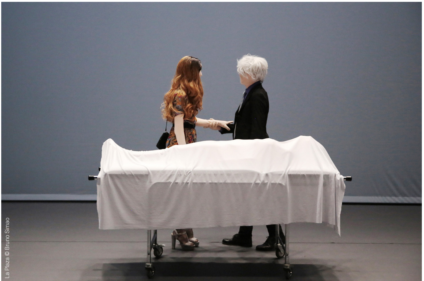
La Plaza

een onderzoeksproject op en presenteren we deze fragmenten aan een publiek. De titel LA PLAZA (het plein) brengt ons weer bij het onderwerp van de publieke ruimte. Daar komen publieke thema's aan bod – maar ook alle tegenstrijdigheden van het publieke. Vandaar de titel. En daarom hebben we het ook over thema's die ons in wezen allemaal aanbelangen, ieder vanuit zijn eigen invalshoek. Iedereen zal er zo zijn mening over hebben en het op zijn/haar manier beleven. En daar hebben wij geen controle over. Dat is waar we het over willen hebben. Dat willen we tonen op een podium – wat in feite hetzelfde is als een plein omdat het een ruimte is waar iets publiek gemaakt en getoond wordt.