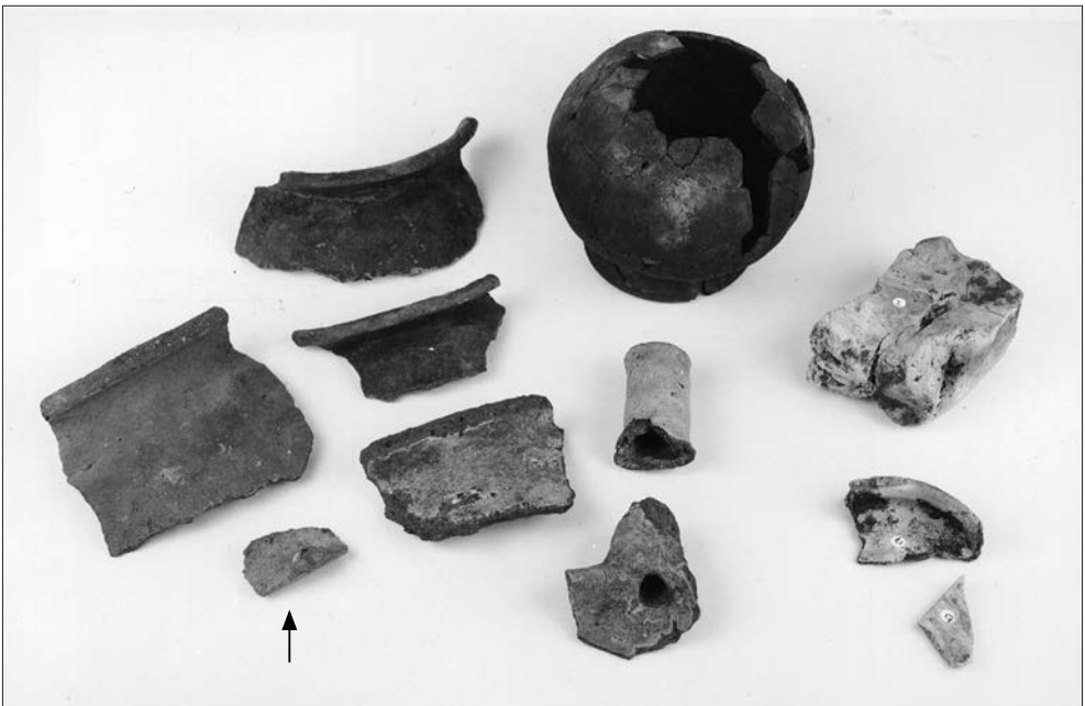
Afb. 5. Selectie van het gevonden aardewerk, opgraving Peizerweg. Datering: 11de/12de eeuw, opgraving Peizerweg. De randscherf (bij het pijltje) dateert van rond het begin van de jaartelling.