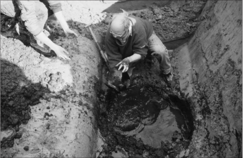
Afb. 8. Twee foto's van de waterput op kavel B1 31. De vulling van de put is ingezakt. Op de bodem van de put bevonden zich enkele kogelpotten.