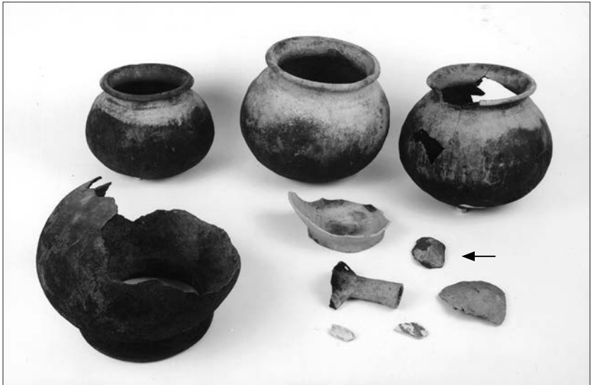
Afb. 7. Enkele vondsten van de kavels B1 28 en 31. Datering: 11de/12de eeuw. Bij het pijltje ligt het fragment van een bodem van een pot van rond het begin van de jaartelling.

kon op deze plaats geen opgeworpen hoogte worden getraceerd. Mogelijk is deze bij het aanleggen van een vijver, direct ten zuiden van de vindplaats al verdwenen. Onder het bekende venige laagje werden grondsporen aangetroffen, die met de achttiende-eeuwse bewoning niets van doen hadden: rechthoekige kuilen met een venig randje; veel ronde, loodrecht naar beneden gegraven waterputten (vaak met mest gevuld, diameter 60 tot 100 cm) en enkele sloten. Het vondstmateriaal hieruit is tamelijk divers en dateert uit ongeveer de 11de/12de eeuw. Het betreft kogelpotten, enkele houten voorwerpen, maar ook ijzerslakken, verbrand huttenleem en een enkel turfje (afb. 7). Het totaal van de vondsten oogt iets jonger dan dat van de Peizerweg-opgraving, vanwege het veelvuldiger voorkomen van aardewerk uit Pingsdorf (Oost-België).