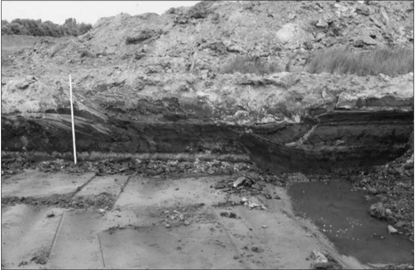
Afb. 6. Doorsnede door een hoofdgeul, aan de oostzijde van de zandrug, ten noorden van de A7, aan de westkant van de wijk Buitenhof. Aan de rechterzijde is de geul in het zand ingesneden.