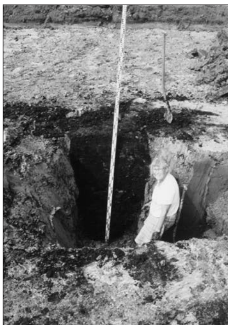
Afb. 3. Doorsnede door een waterput, opgraving Peizerweg.