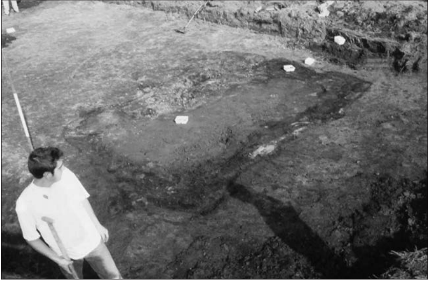
Afb. 4. Kuil met een venige rand en zandige klei in het centrum, opgraving Peizerweg.

re sneed door het veenpakket heen. De vulling van beide bestond uit venige klei en zachte (ongerijpte), schone kleilagen, terwijl de jongste geul bovenin een pakket gerijpte, zandige klei bevatte. Die laatste geul doorsneed bovendien een oudere, gegraven kuil.