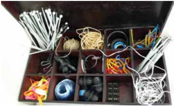
ערכת חומרי חיבור באשכול גנים ילדי טבע בכפר מנדה

חשוב מתהליך הבנייה. הילדים נעזרים בחבריהם להעלאת רעיונות ולפתרון הבעיות לאורך כל התהליך.