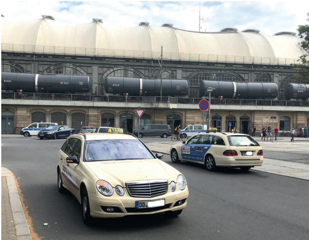
Taxis am Dresdner Hauptbahnhof

Intelligente Systeme können Bussen und Bahnen mehr Kunden bringen - und auch das Taxi könnte profitieren