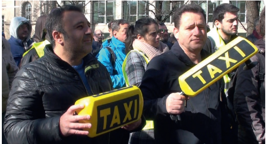
Schon häufig haben Münchens Taxifahrer gegen Uber auf der Straße demonstriert. Jetzt haben sie auch vor Gericht Recht bekommen

Nach Ausführung des Beförderungsauftrags hat der Mietwagen unverzüglich zum Betriebsitz zu-