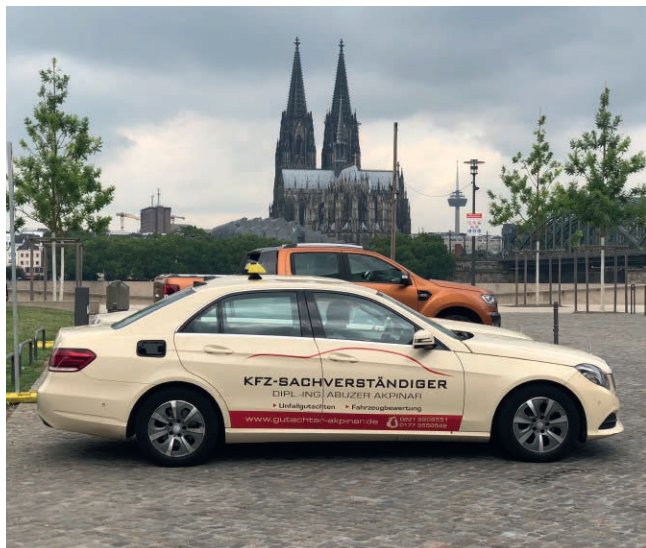
Warten auf Fahrgäste in Köln