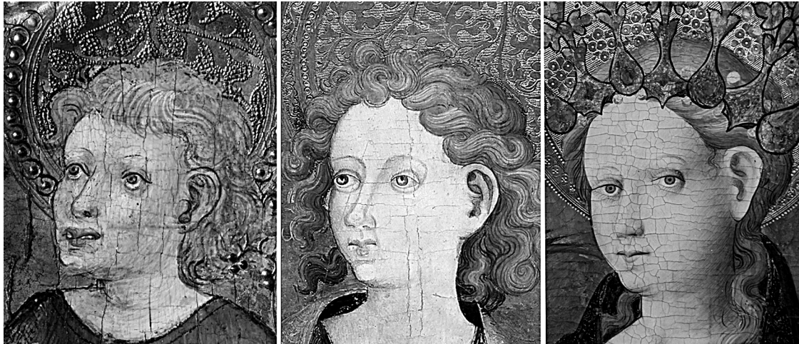
Fig. 6. Gonçal Peris Sarrià, San Juan , detalle predela del retablo de Rubielos de Mora. Atribuida a Gonçal Peris Sarrià, San Juan Evangelista , colección particular. Atribuida a Gonçal Peris Sarrià, Santa Bárbara , detalle retablo del Museu Nacional d'Art de Catalunya.

definitivas. Se defiende emplear de manera normalizada el nombre del pintor de forma completa: Gonçal Peris Sarrià, para evitar confusiones.