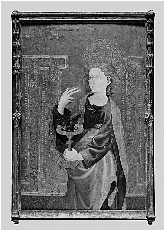
Fig. 5. Atribuida a Gonçal Peris Sarrià. San Juan Evangelista . Colección particular.

en el oro, los rasgos fisonómicos y las tonalidades de las carnaciones lo identifican más con las obras posteriores de la época de Puertomingalvo. Si analizamos el dibujo del santo evangelista de la tabla privada con el mismo personaje en la Santa Cena de la predela de Rubielos, vemos la coincidencia del modelo en un precedente todavía no tan desarrollado técnicamente (fig. 6). En la misma dirección se advierten analogías con determinados detalles del retablo de San Sebastián de Villar del Cobo, que atribuimos a Jaume Mateu. Las conexiones entre Peris Sarrià y Mateu son constantes y sólo un detallado análisis de la técnica pictórica nos permite encontrar diferencias de estilo en los trazos. 51