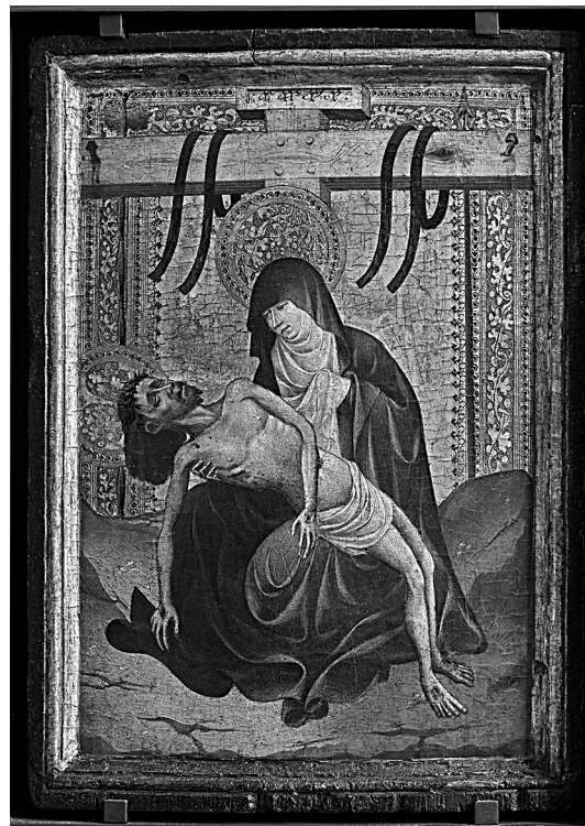
Fig. 7. Atribuida a Gonçal Peris Sarrià. Piedad . Museo del Louvre (París).

A tenor de los documentos aportados en este estudio, la figura de Gonçal Peris queda desdibujada a favor de la su homónimo Sarrià. Intentar definir la personalidad pictórica del primero sin disponer, en este momento, de datos más concluyentes resulta aventurado. Como hemos podido advertir en la documentación, en alguna ocasión el nombre de "Gonçal Peris" hace referencia a Gonçal Peris Sarrià. No debemos descartar que esta circunstancia se pudiera dar en las obras clave tratadas en este estudio.