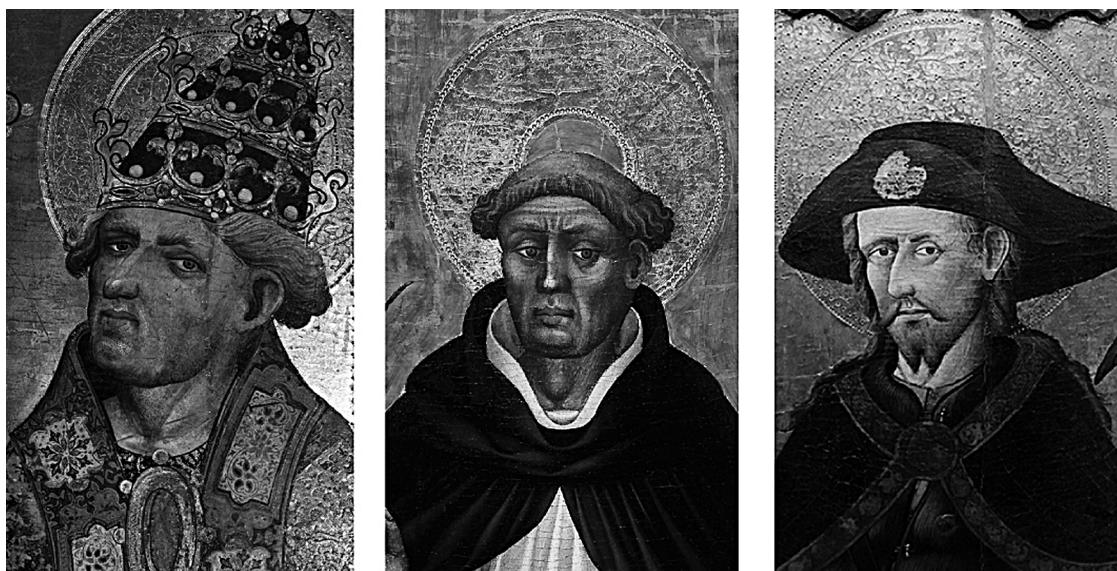
Fig. 1. Documentado como Gonçal Peris, detalles de A) Santa Marta i San Clemente , Catedral de Valencia. B) Santo Domingo , Museo del Prado. C) San Jaime , Museu Nacional d'Art de Catalunya.

En las últimas décadas la interpretación del mapa de la pintura del gótico internacional valenciano ha contribuido a la aportación de un considerable número de propuestas atributivas. En ocasiones, a la luz de nuevos documentos de archivo –no siempre fáciles de comprender–, en otros casos han sido conjeturas más o menos intuitivas que no siempre han aportado conclusiones convincentes. No toda la crítica ha aceptado la hipótesis de dos pintores coetáneos con idéntico apellido. Las investigaciones de Gómez Frechina, Miquel Juan, García Marsilla, o Ruiz i Quesada 6 han considerado poco concluyente la propuesta de dualidad de los Peris y, una vez más se ha vuelto a proponer a un único pintor un extenso número de obras.