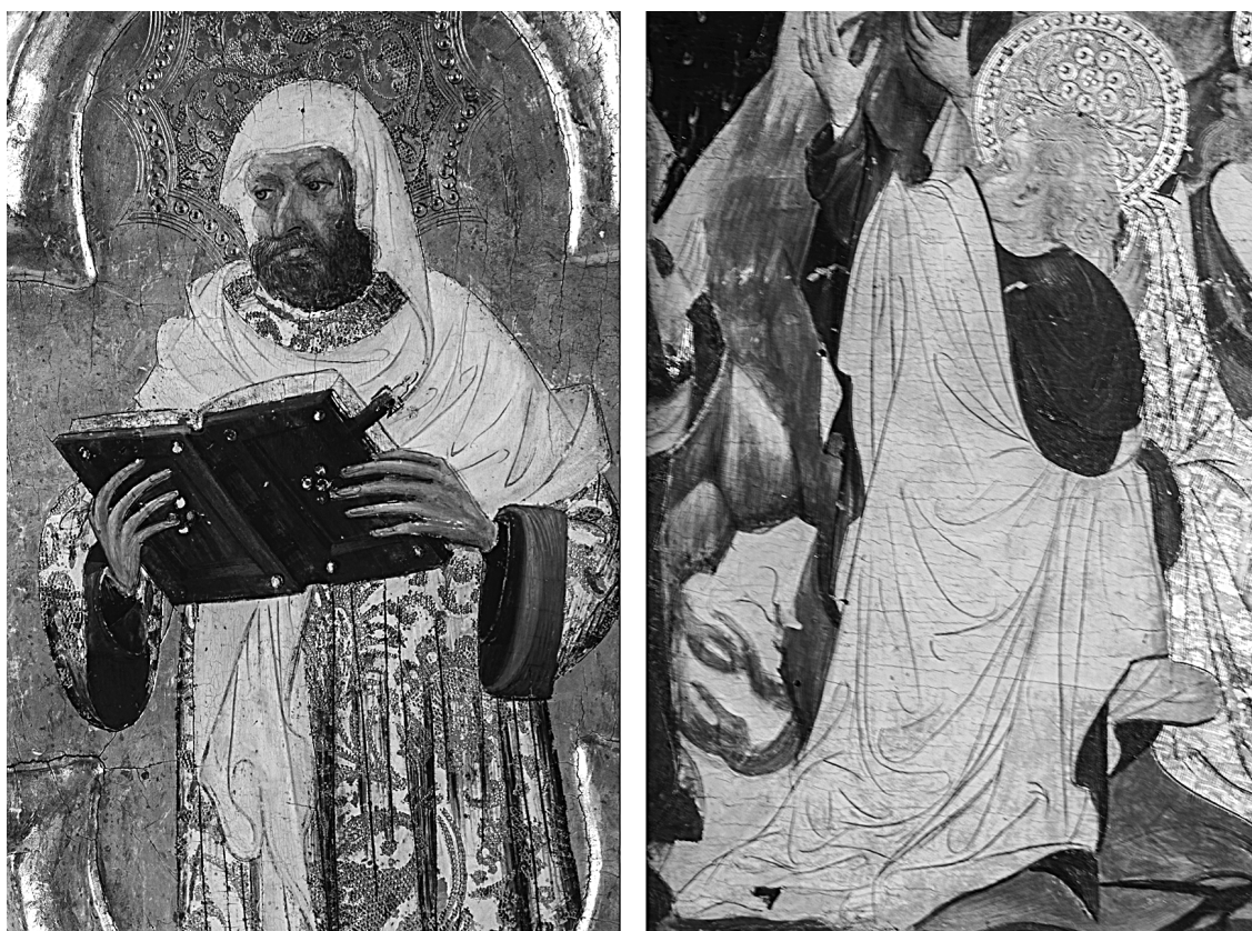
Fig. 3. Gonçal Peris Sarrià, A) reflectografía IR, detalle del Retablo de la Vida de la Virgen , Rubielos de Mora (Teruel). B) Pere Nicolau y Gonçal Peris Sarrià (¿), reflectografía IR, detalle del Retablo de la Virgen , Museo de Bellas Artes de Bilbao.

muchas conexiones con los retablos de los Gozos de la Virgen , como el de Sarrion (Museo de Bellas Artes de Valencia), el de Albentosa (desaparecido), el de Santa Cruz de Moya (Palacio Arzobispal de Cuenca) o el del Museo de Bellas Artes de Bilbao, todas ellas realizadas en los primeros años del siglo XV. Cada una de estas obras ha tenido un devenir histórico diferente que ha influido en su estado de conservación, provocando que la percepción actual de la película pictórica de temple varíe según las circunstancias. Un estudio detallado con imágenes de alta definición y del dibujo subyacente (fig. 3) nos revelan idénticas formas de proceder en la técnica de la pintura iniciada en el taller de Pere Nicolau y continuada después por Gonçal Peris Sarrià y Jaume Mateu.