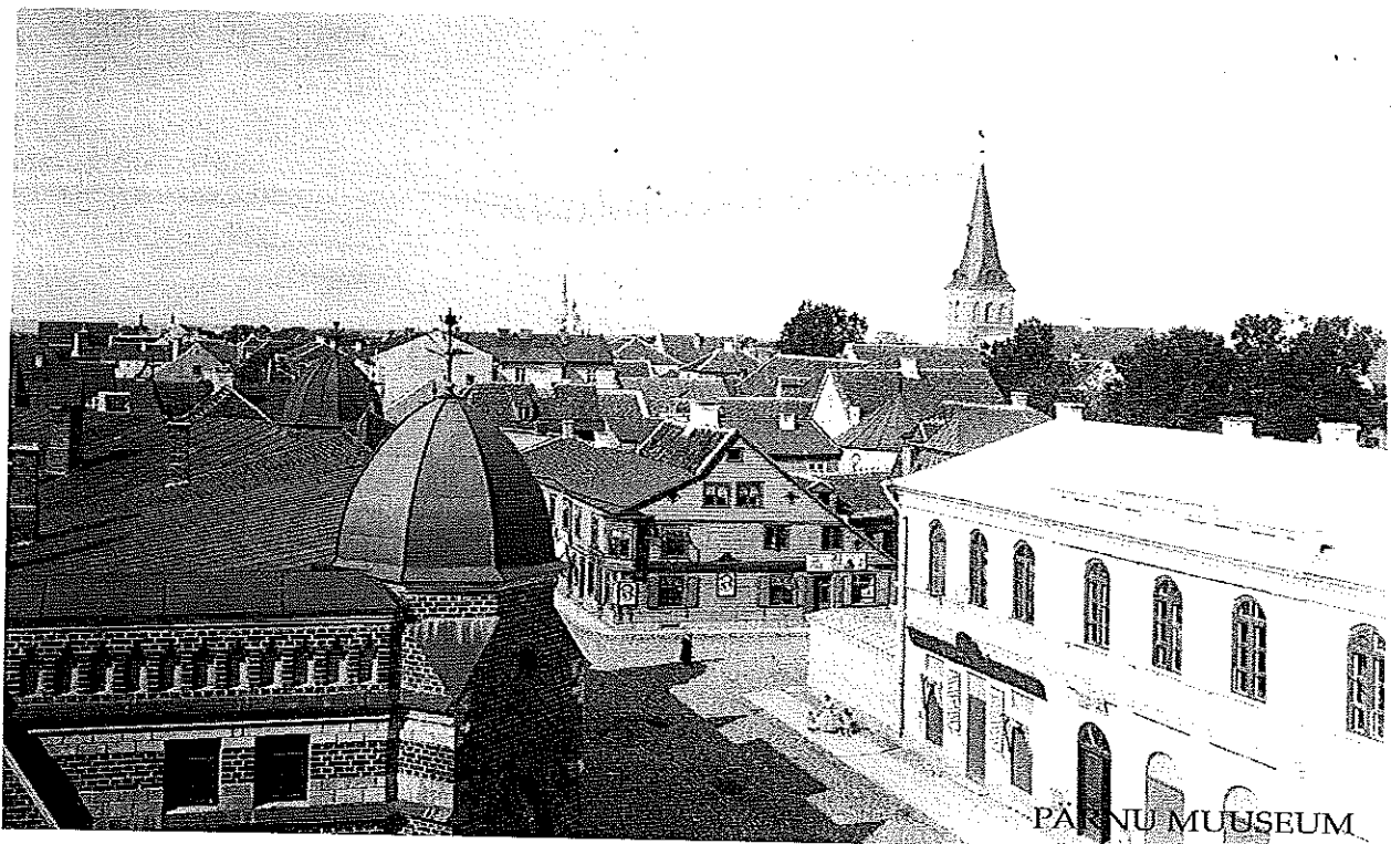
Lisa 3. Vaade Pärnu kesklinnale endise Kleini maja röödult Rütüli ja Ringi tn nurgalt..