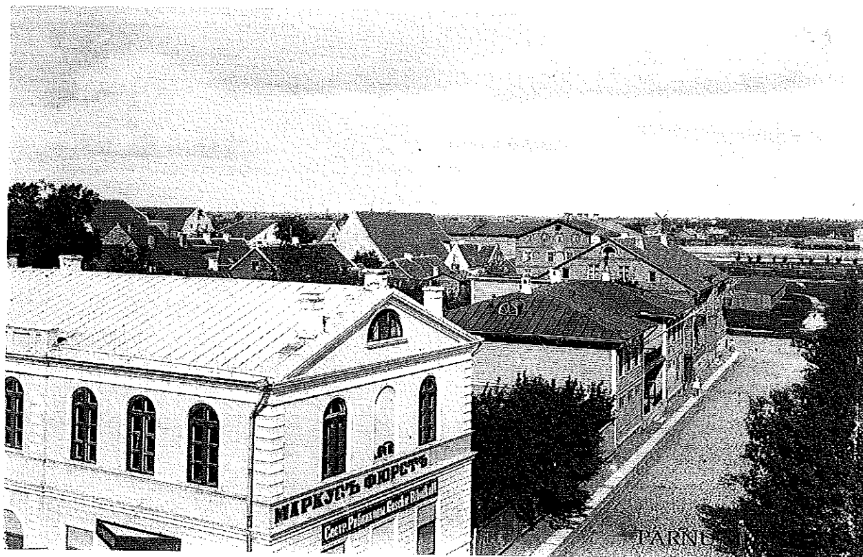
Lisa 4. Vaade Pärnu kesklinnale endise Kleini maja rōdult Rütli ja Ringi tn nurgalt. Esiplaanil osa end. Tūtarlaste kooli majast. "Ansichten von Pernau und Umgegend. Aufnahmen von Georg Ehrmann. 1904-1910."