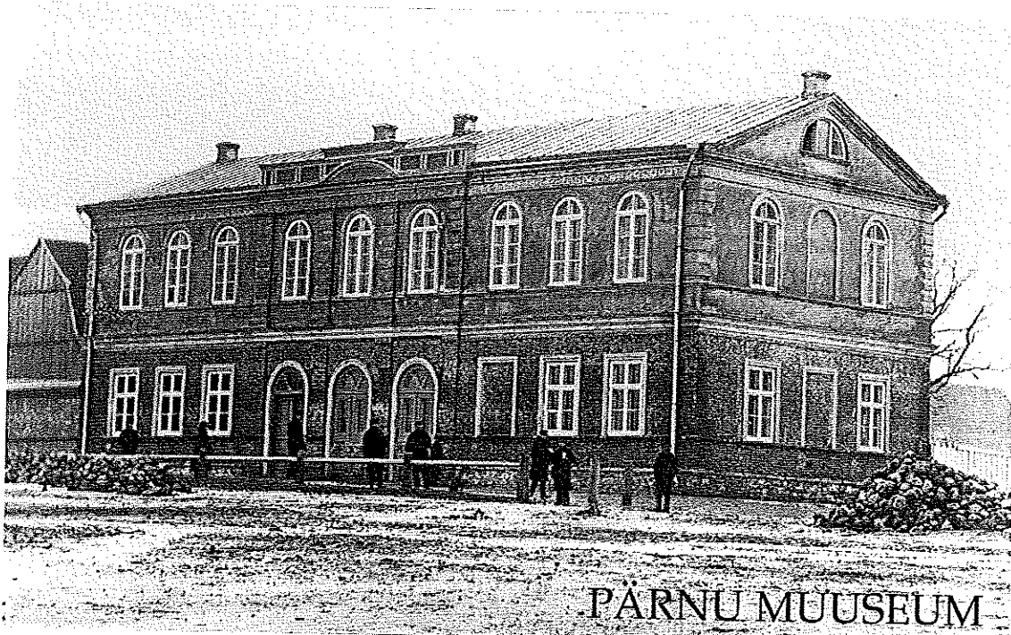
Lisa 2. Tütarlastekooli hoone. 1866. "Album Photographischer Ansichten von Pernau in 25 Blättern nach Original-Aufnahmen von L. Seidlitz."