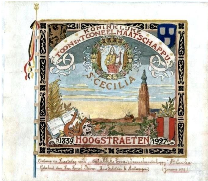
Verenigingsvlag ontworpen door Karel Boom

We mogen er prat op gaan; Zaal CeCilia ( voluit VZW Koninklijke Toon- en Toneelmaatschappij Sint Cecilia) is de oudste culturele vereniging van Hoogstraten en omgeving. Opgericht in 1838 door de notabelen van deze stad, aanvankelijk enkel als harmonie en later uitgebreid met een symfonie- en toneelafdeling. Gezien heel wat stichtende leden ook zetelden in het gemeentebestuur werd de raadzaal van het stadhuis de thuishaven. Daar werden toneelstukken en muziekconcerten opgevoerd. Het bruisende Sint Cecilia vervulde een centrale rol in het culturele leven van Hoogstraten. De schoolstrijd 1879 bracht overal te lande politieke spanningen teweeg. De verzuiling betekende het einde van een hoofdstuk maar ook het einde van het gebruik van de raadzaal door Sint Cecilia. Daarop kocht de vereniging een stukje bouwgrond en in geen tijd werd de zaal neergezet.