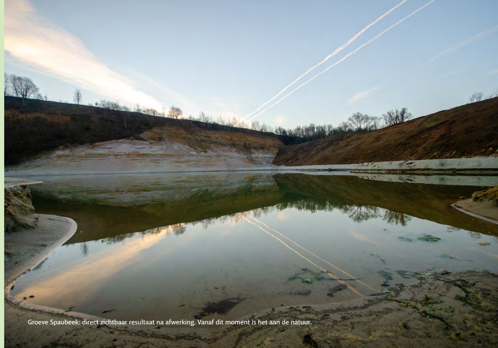
Groeve Spaubeek: direct zichtbaar resultaat na afwerking. Vanaf dit moment is het aan de natuur.

Groeve Schinnen is op dit moment niet meer actief in gebruik. Het streven is om de voormalige productielandschappen beleefbaar en toegankelijk te maken. Op dit moment wordt onderzocht hoe groeve Schinnen op termijn toegankelijk kan worden gemaakt en hoe hier aan natuurontwikkeling kan worden gedaan. Onder het kopje "recreatie" worden reeds mogelijke ontwikkelingen toegelicht voor groeve Schinnen.