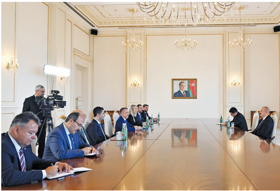
Türkiyə ilə Azərbaycan arasında münasibətlər "Bir millət, iki dövlət" prinsipi əsasında inkişaf edir.