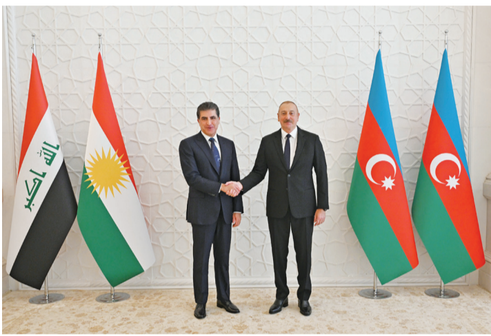
İyulun 18-də Azərbaycan Respublikasının Prezidenti İlham Əliyevin ölkəmizdə işğar səfərdə olan İraq Kürdüstan Regionunun başçısı Neçirvan Bərzani ilə təkbətək görüşü olub.

Söhbət zamanı Prezident İlham Əliyev ilə Neçirvan Bərzani arasında bu ilin fevralında Münxendə keçirilən görüş xatırlanıb. Həmin görüşdə əməkdaşlığın əsas istiqamətlərinin müəyyənləşdirilməsi ilə bağlı səmərəli müzakirələrin aparıldığı qeyd olunub, Neçirvan Bərzaniyə Azərbaycanın əməkdaşlığımızın dinamikasının artmasına töhfə verəcəyi bildirilib.