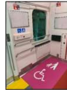
フリースペース (写真: E131系相模線)