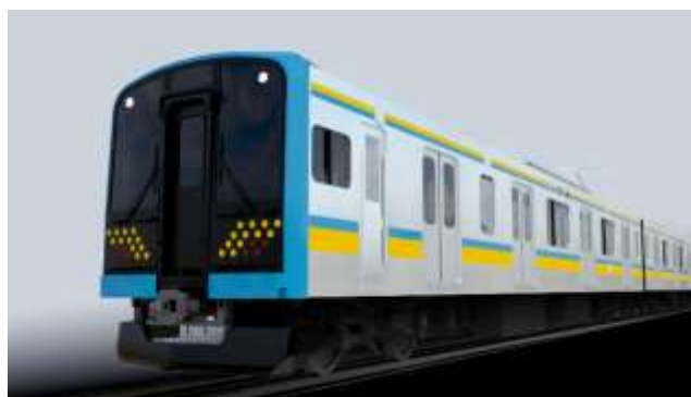
鶴見線に投入するE131系