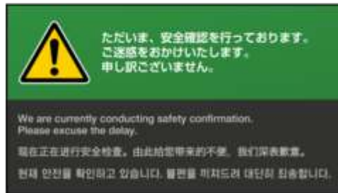
多言語による情報提供画面 (イメージ)