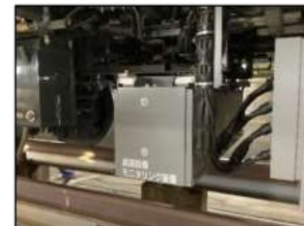
線路設備状態監視 (イメージ)