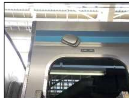
乗降確認カメラ (写真: E131系相模線)