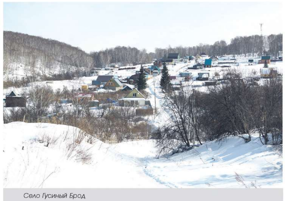
Село Гусиный Брод