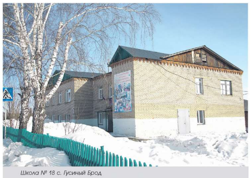
Школа № 18 с. Гусиный Брод