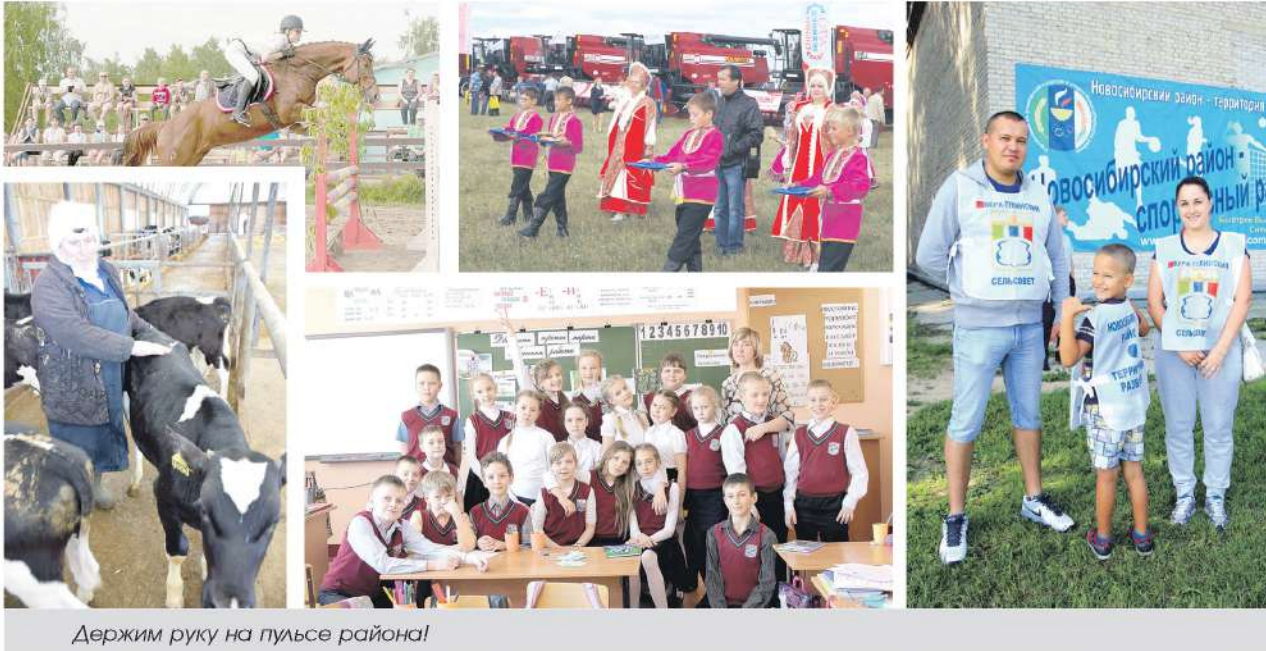
Держим руку на пульсе района!

В июле 2019 года газете «Новосибирский район — территория развития» исполняется 5 лет. Первый юбилей — время оглянуться, посмотреть назад и оценить: о чем мечтали, что планировали, что получилось, чего достигли, к чему стремиться дальше. Пять лет — много это или мало, судите сами.