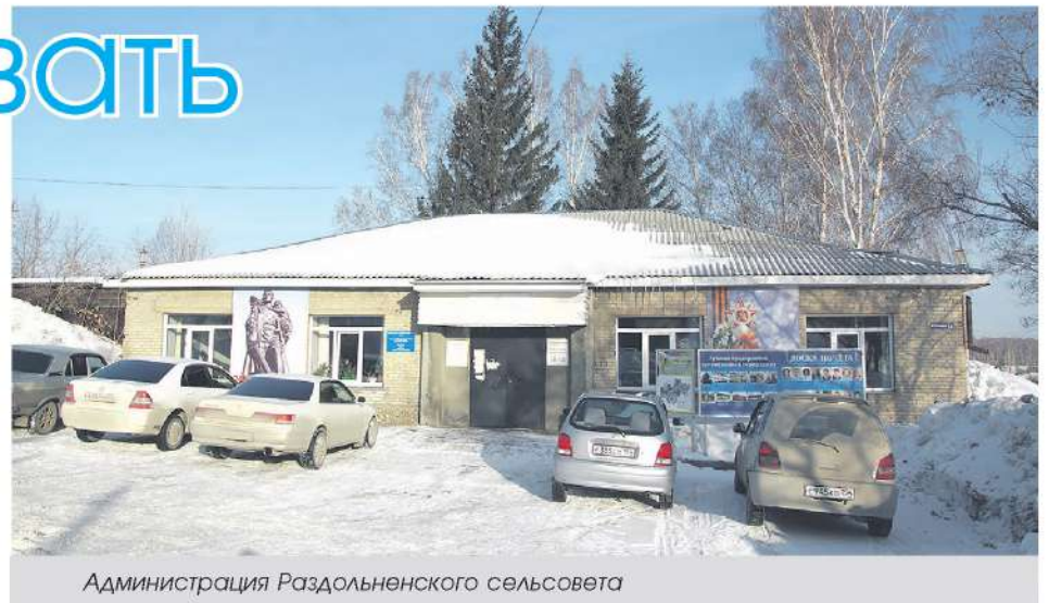
Администрация Раздольненского сельсовета