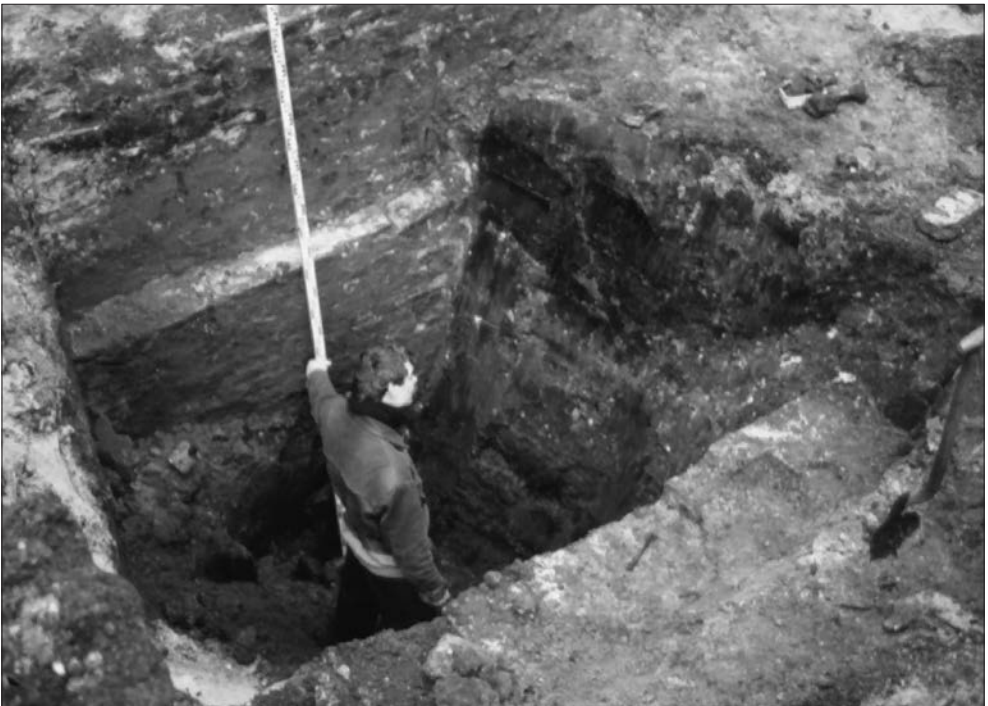
Afb. 5. De laat-middeleeuwse beerput, Folklingestraat 39.

Op de kruising met het Hoogstraatje, aangelegd omstreeks 1600 3 , bevond zich op ongeveer 1,5 m onder maaiveld een rechthoekige constructie van palen