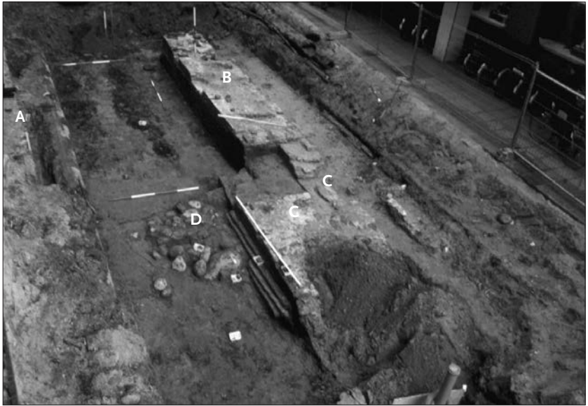
Afb. 2. Overzicht van de opgraving in noordelijke richting. Middenin achteraan het tufstenen fundament. Daarvoor, inspringend en uitspringend, uitbreidingen uit de 13de en 14de eeuw.

keien. Van de twee fundamente was nog enig opgaand muurwerk aanwezig (afb. 2). Het westelijke deel bevond zich onder 18de-eeuws metselwerk, onder de galerij van het gebouw De Faun uit 1935 (afb. 2, A). Aan de binnenzijde van dit fundament bevond zich een riool uit de jaren '30. Het oostelijk fundament bleek danig verstoord door diverse kabels, leidingen en het tweede riool (afb. 2, B). Een strook van ongeveer een meter breed, aan de binnenzijde van de doorgang onder de poort was bewaard.