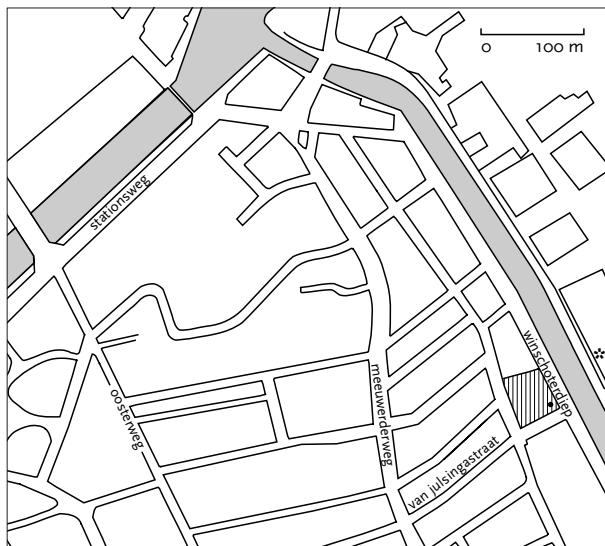
Afb. 6. Situatiekaart met de opgegraven akker (verticale arcering) en de proefopgraving (ster). Tekening: overgenomen uit: Kortekaas 1987, afb. 1.