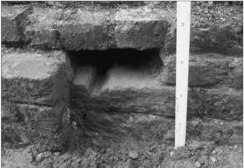
Afb. 3. Duimblokje aan de binnenzijde van het westelijk fundament.

keien. Van de twee fundamente was nog enig opgaand muurwerk aanwezig (afb. 2). Het westelijke deel bevond zich onder 18de-eeuws metselwerk, onder de galerij van het gebouw De Faun uit 1935 (afb. 2, A). Aan de binnenzijde van dit fundament bevond zich een riool uit de jaren '30. Het oostelijk fundament bleek danig verstoord door diverse kabels, leidingen en het tweede riool (afb. 2, B). Een strook van ongeveer een meter breed, aan de binnenzijde van de doorgang onder de poort was bewaard.