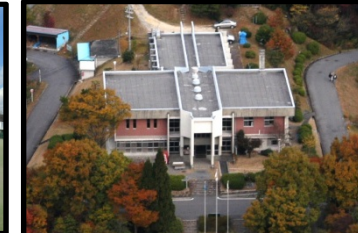
野外活動センター