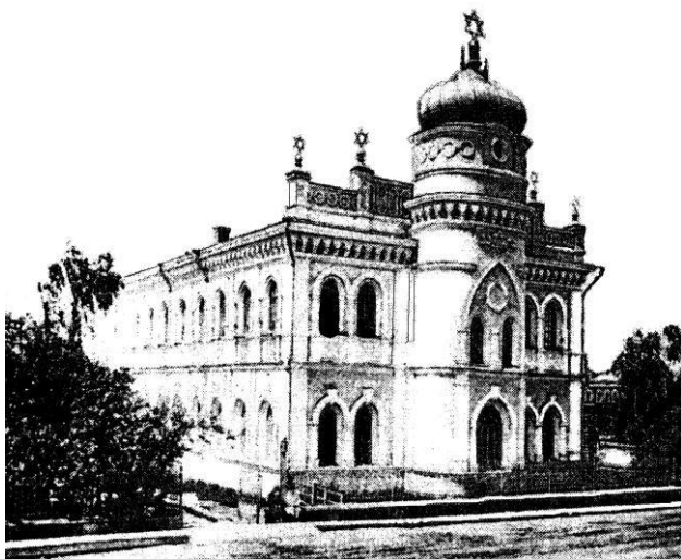
Рис. 5. Томская Хоральная синагога, 1902 г.