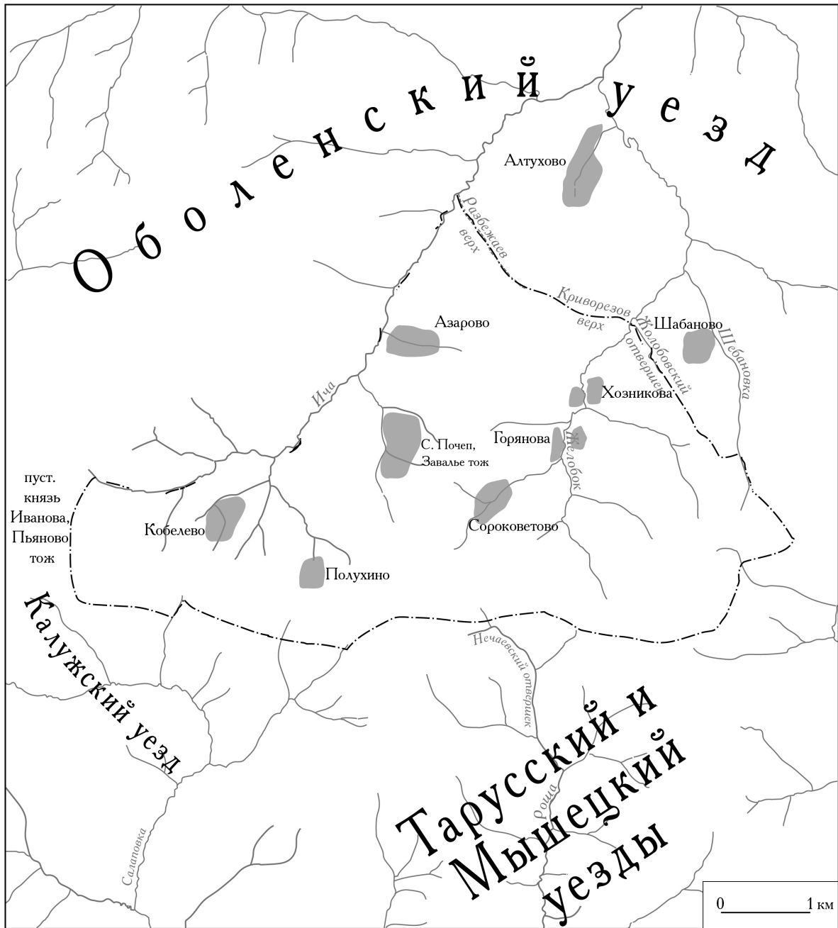
Рис. 1. «Волость»-землевладение с. Почеп в XV–XVIII вв.