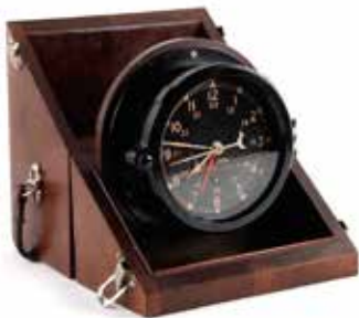
205 U.S ARMY