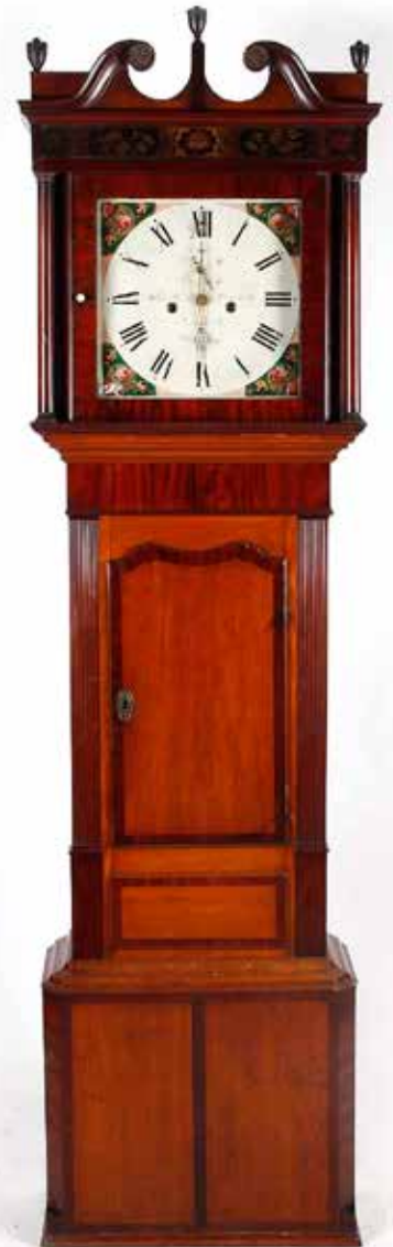
308 Staande klok