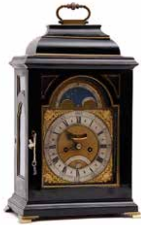
330 Boston Tafelklok