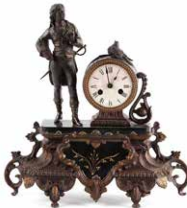
157 man op top