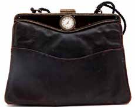
251 Tas met klok