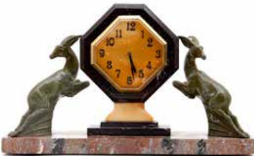
97 Art Deco