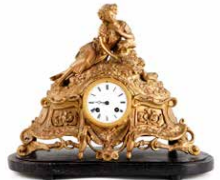
361 pendule met vrouw