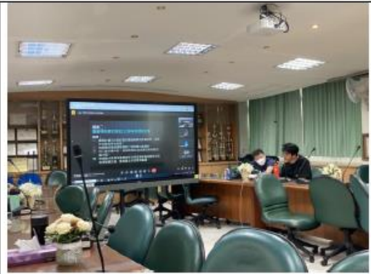
審議特殊需求領域 112 學年度課程計畫