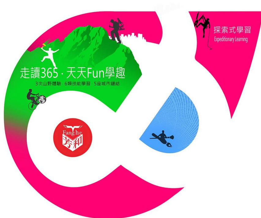
圖 1 芳和實中學習圖像

為回歸教育之本質與目的，實踐教育創新，提供教育選擇，帶領學生面對未來世界及社會變遷之學習挑戰，將學習連結真實世界的問題與需求，創造鼓勵深度投入學習的環境，本校以「 基本學力奠基、多元能力開發、跨域主題思考 」為方向，規劃以 探索學習 (Expeditionary Learning)為主軸、 多元智能 (Multiple Intelligences)為脈絡、 全人教育 (Holistic Education)為目標之學校型態實驗教育方案；在「探索、跨域、遠征」的學校願景領導下，期能培育具「自律負責、創新探索、傾聽合作、感恩服務」素養之未來公民。