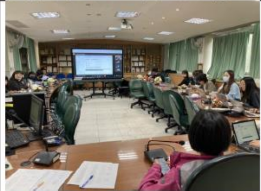
審議 112 學年度國中部課程計畫