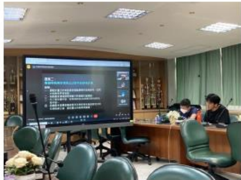
審議特殊需求領域 112 學年度課程計畫