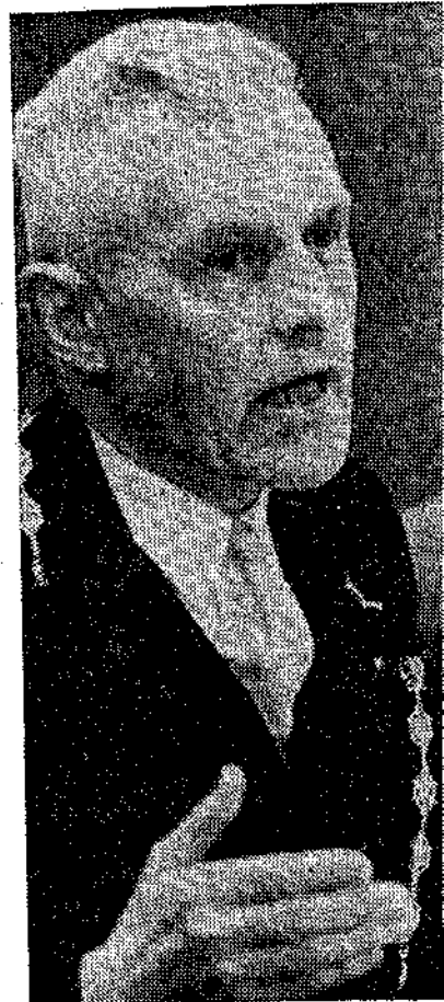
„We hebben een ongelukkig verkiezingsstelsel ...