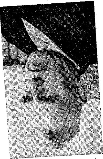
„Er is zo weinig...“

„Wat er nog ontbreekt is de HTS in de wettelijke minnstreek. Dat is een dringende noodzaak willen we de eigen mensen in de chemische industrie doen slagen. De HTS zou ik een grote prioriteit geven. Destijds is er het idee geweest van een scholengemeenschap van Maastriecht, Heerlen en Geleen. Men zou zich kunnen voorstellen dat hier een onderbouw van deze scholengemeenschap kwam met voor de chemie en de meet- en regeltechniek een bovenbouw en de bovenbouw voor andere vakken elders“.