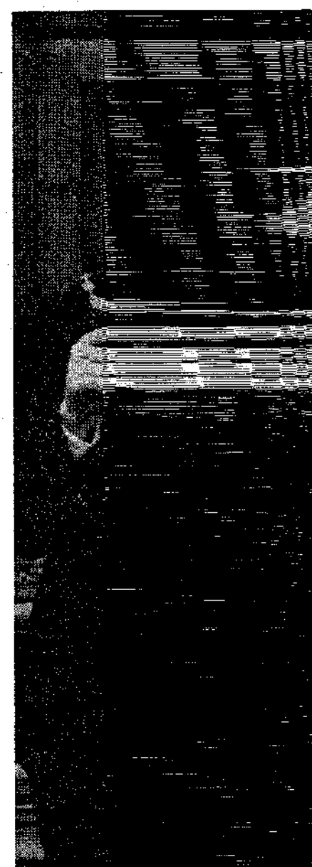
... die m