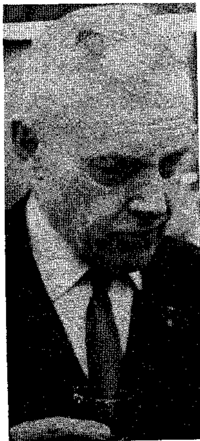
... de positie van de mens"