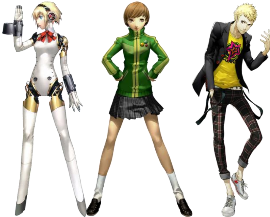
Figuras 10 a 12 – Aigis, Chie e Ryuji, respectivamente

somente a Aigis, porque é a única personagem jogável dos três, e a análise seria mais justa, já que tanto Chie Satonaka quanto Ryuji Sakamoto são jogáveis.