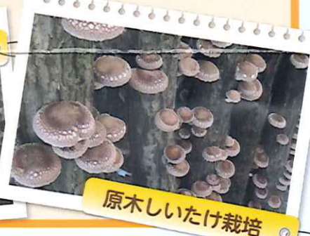
原木しいたけ栽培