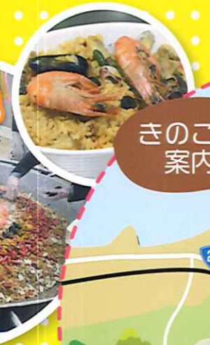
きのこの森案内図