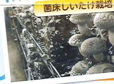
園床しいたけ栽培

自宅で、きのこの森で、きのこを栽培しよう! きのこの生態を学びながらきのこの収穫もできます。