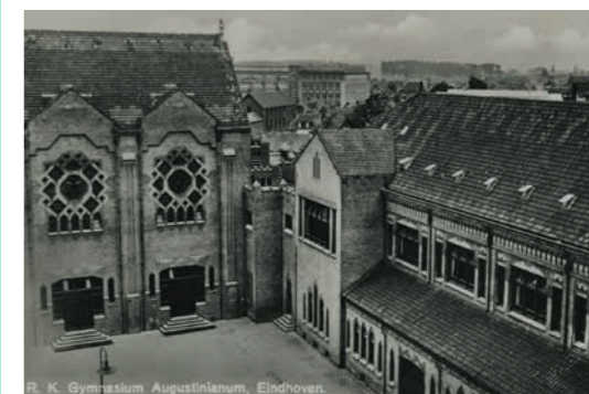
Afbeelding 2 Foto van binnenplaats.

Bellot geloofde heilig in het gebruik van maatverhoudingen. Zijn hele privéarchief is bewaard gebleven en opgeslagen in het CAMT (Le Centre des Archives du Monde du Travail) in het Noord-Franse Roubaix. Dit maakte het