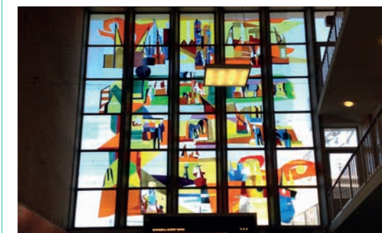
Afbeelding 1 Glasappliqué van Lex Horn in de hal van Station Eindhoven.

Volgens Horn vroeg de moderne architectuur van zijn tijd om een nieuwe benadering van de glaskunst. In de wederopbouwarchitectuur speelt transparantie een belangrijke rol en in toenemende mate werden grote glasoppervlakken toegepast. Hij paste als een van de eersten de techniek van het glasappliqué toe, waarbij stukken gekleurd glas worden gelijmd op een transparante ondergrond zonder loden contouren, zoals gebruikelijk bij glas-in-lood. Lex Horn ontwikkelde deze techniek onder meer in samenwerking met glazeniers van Van Tetterode.