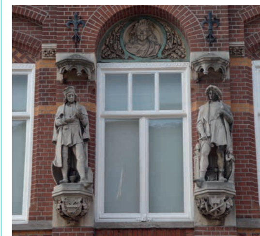
Afbeelding 3 Atelier van Jan Custers aan de Geldropseweg 20.

In 1899 kan hij het bestaande pand aan de Geldropseweg met een nieuw woonhuis uitbreiden en er een expositiezaal inrichten. De gevel wordt voorzien van twee gevelbeelden met ambachtsslieden die personificaties zijn van beeldhouwkunst en edelsmeedkunst. Boven de raampartij bevindt zich een portretmedaillon van Rembrandt, dat met palet en penselen de schilderkunst symboliseert. Deze sculpturale decoratie geeft status aan zijn metier van kunstenaar en ambachtsman (afbeelding 3).