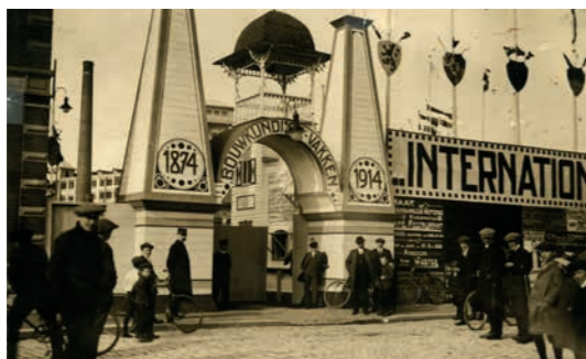
Afbeelding 2 Ingang van de tentoonstelling De Bouwkundige Vakken 1914.