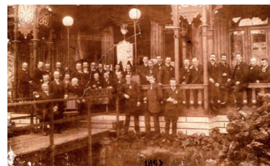
Afbeelding 1 Leden van de Vereniging De Bouwkundige Vakken voor tentoonstellingsgebouw 1893. Archief RHCE

De vereniging is belangrijk voor de Eindhovense cultuurgeschiedenis. Ze organiseerde twee nijverheidstentoonstellingen in 1893 en 1914. Ook richtte ze een Afdeling Ambachtsonderwijs op in mei 1895 die leidt tot de Vereeniging Ambachtsonderwijs voor Eindhoven en Omgeving in 1900. Deze laatste vereniging ziet haar streven bekroond in 1906 met de opening van de nieuw gebouwde Ambachtsschool aan de Sint-Catharinastraat. Na de Eerste Wereldoorlog bestaan er nog plannen voor een derde kunstnijverheidstentoonstelling, maar zover komt het niet.