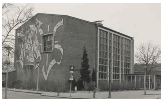
Afbeelding 2 Opstandingskerk Stokroostraat op oude Ansichtkaart.