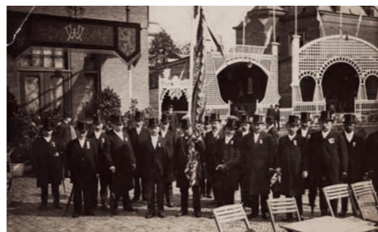
Afbeelding 3 Leden van de Vereniging De Bouwkundige Vakken voor tentoonstellingsgebouw 1914.