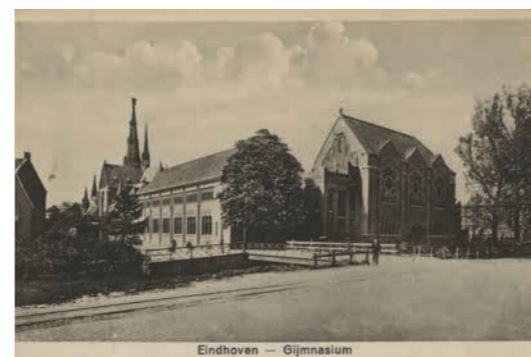
Afbeelding 1 Het Augustinianum complex op een oude ansichtkaart.

Paul Bellot (1876-1944) studeerde in 1900 af als architect aan de Ecole des Beaux-Arts in Parijs. Hij bleef in nauw contact met de Parijse modernistische avant-garde. Zo onderhield hij contact met de schilder Maurice Denis, de filosoof Jacques Maritain en de architect August Perret. Als architect werd Bellot geïnspireerd door Eugene Viollet-le-Duc (1814-1879), een Frans architect en bouw-historicus met een grote passie voor de middeleeuwse architectuur.