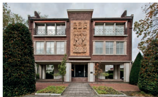
Afbeelding 3 Reliëf Drukkerswereld door Hugo Brouwer.

toepassing van monumentale kunst al eeuwenlang gemeengoed en functioneel. De ongeletterde gelovige werd zo ontzag en kennis over het christendom bijgebracht. In de protestantse geloofsgemeenschap ontstond in de wederopbouwperiode belangstelling voor monumentale kunst. In 1954 verscheen het rapport van de Synode van de Nederlands Hervormde Kerk, waarin werd gewezen op de didactische meerwaarde van de kunst. Hierdoor werden er ook opdrachten gegeven aan kunstenaars voor de tot dan toe meestal ‘beeldloze’ protestantse kerken.