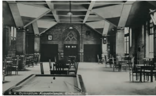
Afbeelding 3 Interieur kapel.

manier bouwde hij op ingenieuze wijze zijn doorsnedes en gevels op (afbeelding 3).