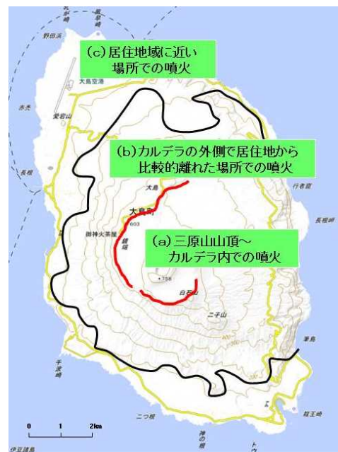
図1 噴火場所の区分け

多量の降灰があった場合、降雨による土石流については、噴火が終息した後も継続することがあるが、土砂災害の観点から警戒され