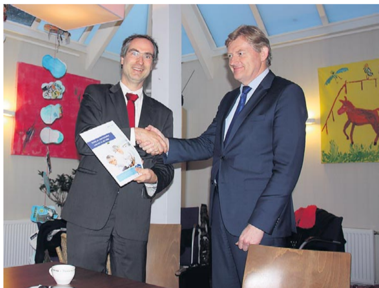
Stadsdeelwethouder De Vries overhandigt de brochure 'Woon lang en gelukkig' aan staatssecretaris Van Rijn.

De brochure is verspreid over verschillende plekken in het stadsdeel. Heeft u hem nog niet gezien? Ga dan naar www.zuid.amsterdam.nl/woonlangengelukkig voor de digitale versie.