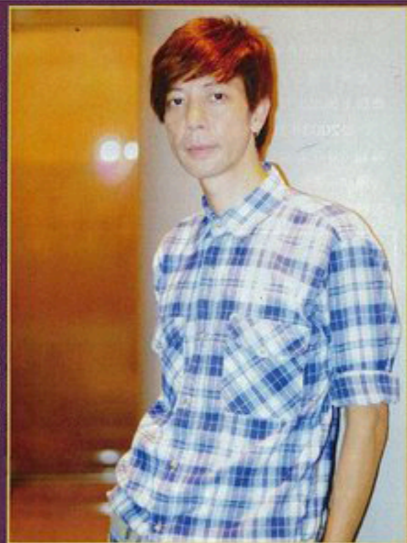
羅金榮至今已播在樂壇上逾廿五年，但始終保持著對音樂的「心誠實」。