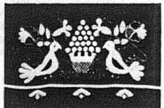
Ілюстрація на запрошенні на відкриття виставки українського народного мистецтва у Стейтовому Музеї в Трентоні. Фрагмент вишивки на рушнику ХУІІІ сторіччя з Київщини.