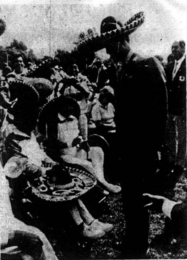
Британський принц Чарлз віддав шану мехіканським спортсменам і їхнім народним традиціям, обравши мехіканський капелюх під час привітання змагунів-інвалідів, які беруть участь у спортозних ігрищах інвалідів у кріслах на колесах, що відбуваються в Бакінгемшарі, Англія.