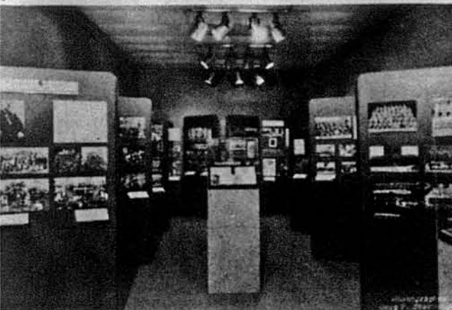
Загальний вид виставки „Історія української імміграції в Америці“, відкрито 19 травня 1984 р.