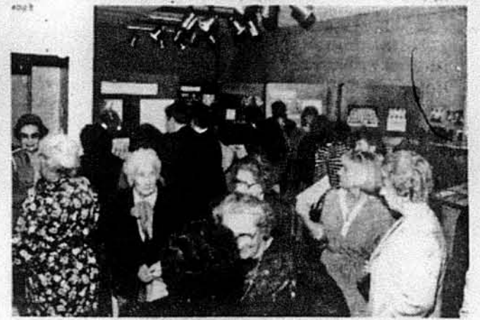
Члени товариства „Український Музей“ і гості на відкритті виставки „Історія української імміграції в Америці“.