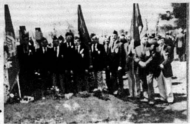
Члени Об'єднання к. Воєнків 2-ї Дивізії Української Національної Армії зі своїми прапорами над свіжою могилкою свого почесного члена маестра Григорія Китастого.

Свідками цієї події були всі члени Капелі Бандуристів на чолі зі своїм улюбленим маестром Григорієм Китастим. З тих часів почалася дружба славного диригента Г. Китастого з воєнками 2-ї Дивізії УНА. Коли створено Об'єднання колишніх Воєнків 2-ї Дивізії УНА, маестро Г. Китастий став його почесним членом. У своєму споміні про цю першу зустріч з воєнками 2-ї Дивізії УНА він писав: „Це було в Німеччині, коли в березні 1945 року 2-га Дивізія УНА приймала присягу. Був похорий, тихий ра-