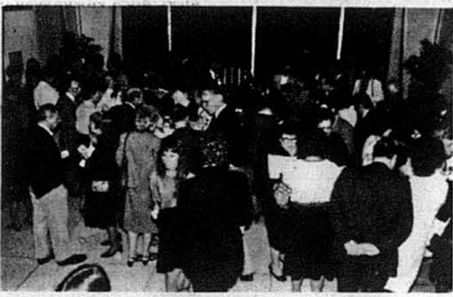
Прийняття в день відкриття виставки українського народного мистецтва в Стейтовому Музеї в Трентоні.