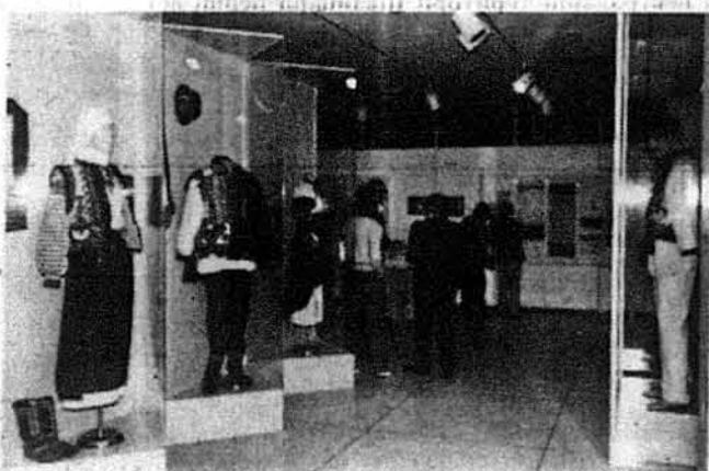
Загальний вигляд виставки українського народного мистецтва в Стейтовому Музеї в Трентоні.