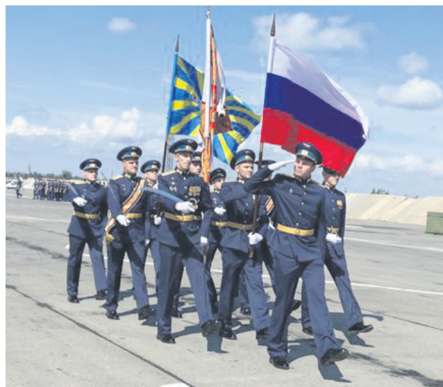
Защитники нашей Родины гордо пронесли по плацу аэродрома Государственный флаг РФ, флаг ВКС и Боевое знамя полка.