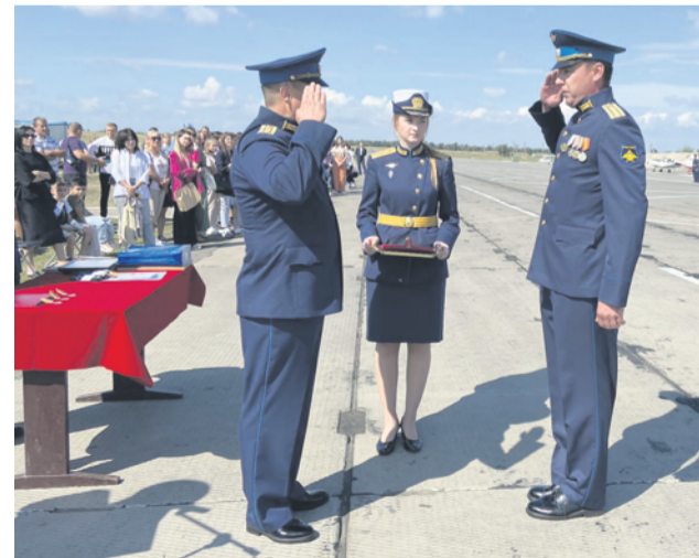
В этот день за выполнение воинского долга, за заслуги перед Отечеством, мужество, отвагу и самоотверженность, проявленные при исполнении воинского долга, морозовских офицеров наградили медалями.