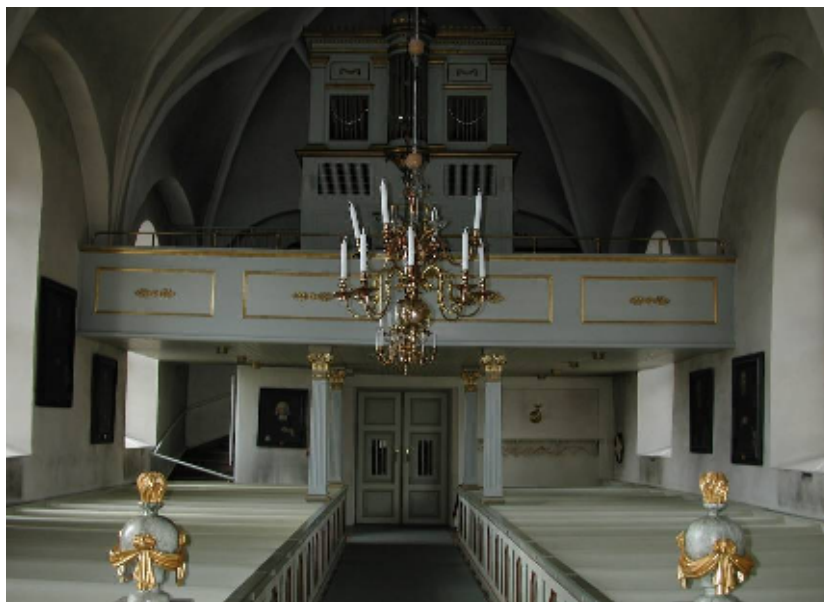
Orgelfasaden utformades 1840 av Pehr Gullbergsson, mest verksam i Upplands kyrkor

Norra sidokapellet har ett lägre kryssvalv och lackat tegelgolv. Det är inrett med flyttbart altarbord och lösa stolar, för mindre samlingar.