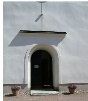
Tornet blev helt nyputsat 1998

Kolbäcks kyrka omfattar långhus som i öster har en kort tresidig koravslutning med strävpelare, mot norr en utbyggnad för sakristia och sidokapell, samt västtorn. Långhusets murar består av gråsten, fransett koravslutningen av tegel. Tornet är murat av gråsten upp till ungefär halva sin höjd och ovanför tegelmurat. Fasaderna är genomgående slätputsade, sockeln struken med ljusgrå cementfärg och väggarna kalkavfärgade i gulaktigt vitt. Fönsteröppningarna är rundbågiga och har fönstersnickerier av varierande ålder men nästan samma utseende, målade med ljusgrå linoljefärg. Tornet har med gesimser indelats i tre avsatser: I den nedersta är en rundbågig västportal med rakt överstycke, i den mellersta är klockvåningen med rundbågiga, tjärade ljudluckor och i den översta är urtavlor av svart plåt med förgyllda visare, en i varje väderstreck. Ovanpå tornets mur är en nyklassicistisk lanternin i svartmålat trä, med hörnpilastrar och snidade ornament, kupoltak, förgyllt kors och kula. Lanterninen omges av ett smidesräcke infäst i hörnpilastrar prydda med förgyllda urnor.