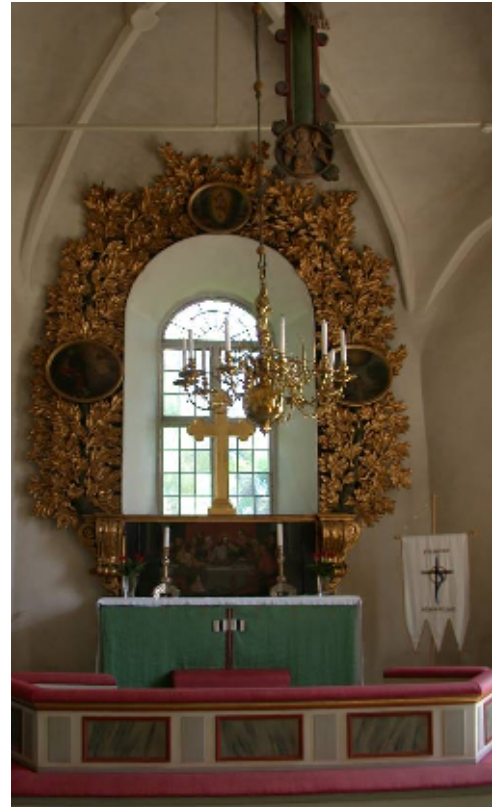
Kyrkorummet renoverades senaste gångerna etappvis, 1983 och 1985

Kyrkorummet är täckt med fyra stjärnvalv, kalkade i en svagt gulbruten nyans. Dekorationsmåleriet begränsar sig till ett invigningskors i koret. Golven i mittgång och bänkkvarter är belagda med lackade bräder. Bänkarna från 1887 stod från början i öppna rader, men vid omgestaltning 1940 fick de fasader tillverkade med bevarade bänkskärmar från 1752 som förlaga. Skärmarna är ljusgrå, har mörkare grå överliggare, röda listverk och marmorerade fyllningar. Längst fram sitter snidade, förgyllda barockdekorationer på hörnpilastrar. Predikstolen vid främre norra valvpelaren i barockstil är åttasidig, prydd med snidade, förgyllda akantusblad.