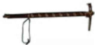
HORSEMAN'S PICK ARZHAN MOUND (VII-VIII CENTURIES B.C.) TUVA 750x190