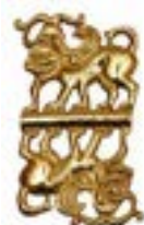
СИНКРЕТТИК ПОЛИМОРФТЫ ТІРШІЛІК ИЕСІ ЕСІК ҚОРҒАНЫ (Б.З.Д. V- III ҒҒ.) ҚАЗАҚСТАН 65x35