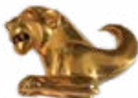
КРЕПЛЕНИЕ В ВИДЕ БАРСА КУРГАН ПАЗЫРЫК, V-IV века до н.э. 40x30x14