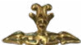
СФИНКС ДВУХСТОРОННИЙ, КУРГАН БЕРЕЛ, IV-III вв. до н.э., ВОСТОЧНЫЙ КАЗАХСТАН 65x30x20