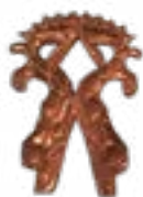
CHEEK FORK IN THE FORM OF TWO ELKS BEREL MOUND (IV-III CENTURIES B.C.) KAZAKHSTAN 150x105