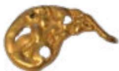
УКРАШЕНИЯ ПАРАДНОГО ОБЛАЧЕНИЯ ПО ПРИНЦИПУ «ЗООЛОГИЧЕСКОЙ ГОЛОВЛОМКИ», ЖАЛАУЛИНСКИЙ КЛАД, V-III вв. до н.э.