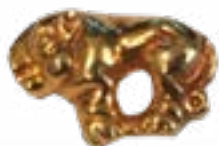
БЛЯШКА В ВИДЕ КОШАЧЬЕГО ЖИВОТНОГО КУРГАН АРЖАН (VII-VIII вв. до н.э.) ТУВА 22x15x5