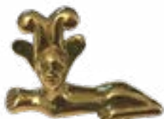
СФИНКС ОБЕРНУТЫЙ ВЛЕВО, КУРГАН БЕРЕЛ, IV-III вв. до н.э., ВОСТОЧНЫЙ КАЗАХСТАН 50x32x18