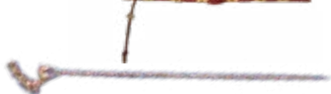
БҰҒЫ ТҮРІНДЕГІ ТӨБЕСІ БАР ТҮЙРЕУІШ АРЖАН ҚОРҒАНЫ (Б.З.Д. VII-VIII ҒҒ.) ТУВА 316x40x25