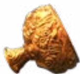
ПАТШАЙЫМНЫҢ РӘСІМДІК ТОСТАҒАНЫ АРЖАН ҚОРҒАНЫ (Б.З.Д. VII-VIII ҒҒ.) ТУВА 42x42x37