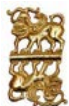
СИНКРЕТИЧЕСКОЕ ПОЛИМОРФНОЕ СУЩЕСТВО КУРГАН ИССЫК (V-III вв. до н.э.) КАЗАХСТАН 65x35