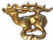
ҰШАТЫН БҰҒЫ ЖАЛАУЛЫ ҚАЗЫНАСЫ (Б.З.Д. V- IV ҒҒ.) ҚАЗАҚСТАН 38x28x8