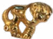
БЛЯШКА В ВИДЕ ТИГРА ОБЕРНУТОГО ВПРАВО ТАЛДЫ-2 (VI-V вв. до н.э.) КАЗАХСТАН 23x17x7