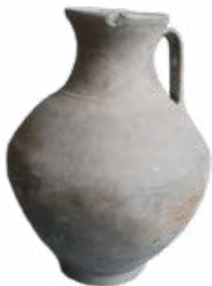
ҚЫШ-ҚҰМЫРА, СҰР САЗДЫ (ПРОХОР ҚОРЫМЫНАН).

Биіктігі 22,9 см, негізінің диаметрі 15 см.