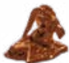
АРҚАР АРЖАН ҚОРҒАНЫ (Б.З.Д. VII-VIII ҒҒ.) ТУВА 15x11x10