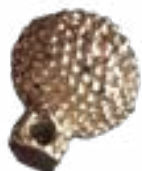
СЕРЬГА С ПОДВЕСКОЙ В ВИДЕ ШАРИКА, V-III вв. до н.э., ЛЕБЕДЕВКА, ЗАПАДНЫЙ КАЗАХСТАН 20x18