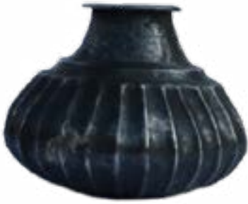
СОСУДИК УЗКОГОРЛЫЙ С РИФЛЕНЫМ ТУЛОВОМ ИЗ ФИЛИППОВСКОГО «ЦАРСКОГО» КУРГАНА №1 В ИЛЕКСКОМ РАЙОНЕ.

Цинк, алюминий, медный сплав. Высота 7,8 см, диаметр венчика 4,2 см.