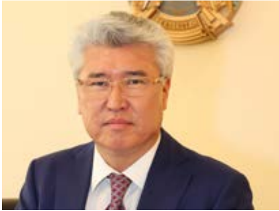
АРЫСТАНБЕК МУХАМЕДИУЛЫ, МИНИСТР КУЛЬТУРЫ И СПОРТА РЕСПУБЛИКИ КАЗАХСТАН

Выставочный проект «Золото скифов» – один из важных в Комплексной программе культурного сопровождения Международной выставки ЭКСПО-2017 в Астане.