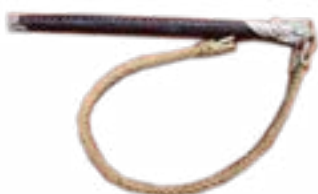
A WHIP WITH WOLF FIGURE PAZYRYK MOUND, V-IV CENTURY B.C. 520x50