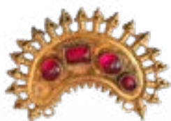
КОЛТЫ В ПОЛИХРОМНОМ СТИЛЕ, ЗЕРНЬ, ФИЛИГРАНЬ, ИНКРУСТАЦИЯ, СЕМИРЕЧЬЕ, III-V вв. н.э., МОГИЛЬНИК АКТАС 1, СЕМИРЕЧЬЕ 50x40