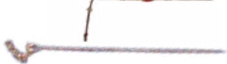
HAIRPIN WITH DEER ON TOP BURIAL MOUND ARZHAN (VII-VIII BC) TUVA 316x40x25