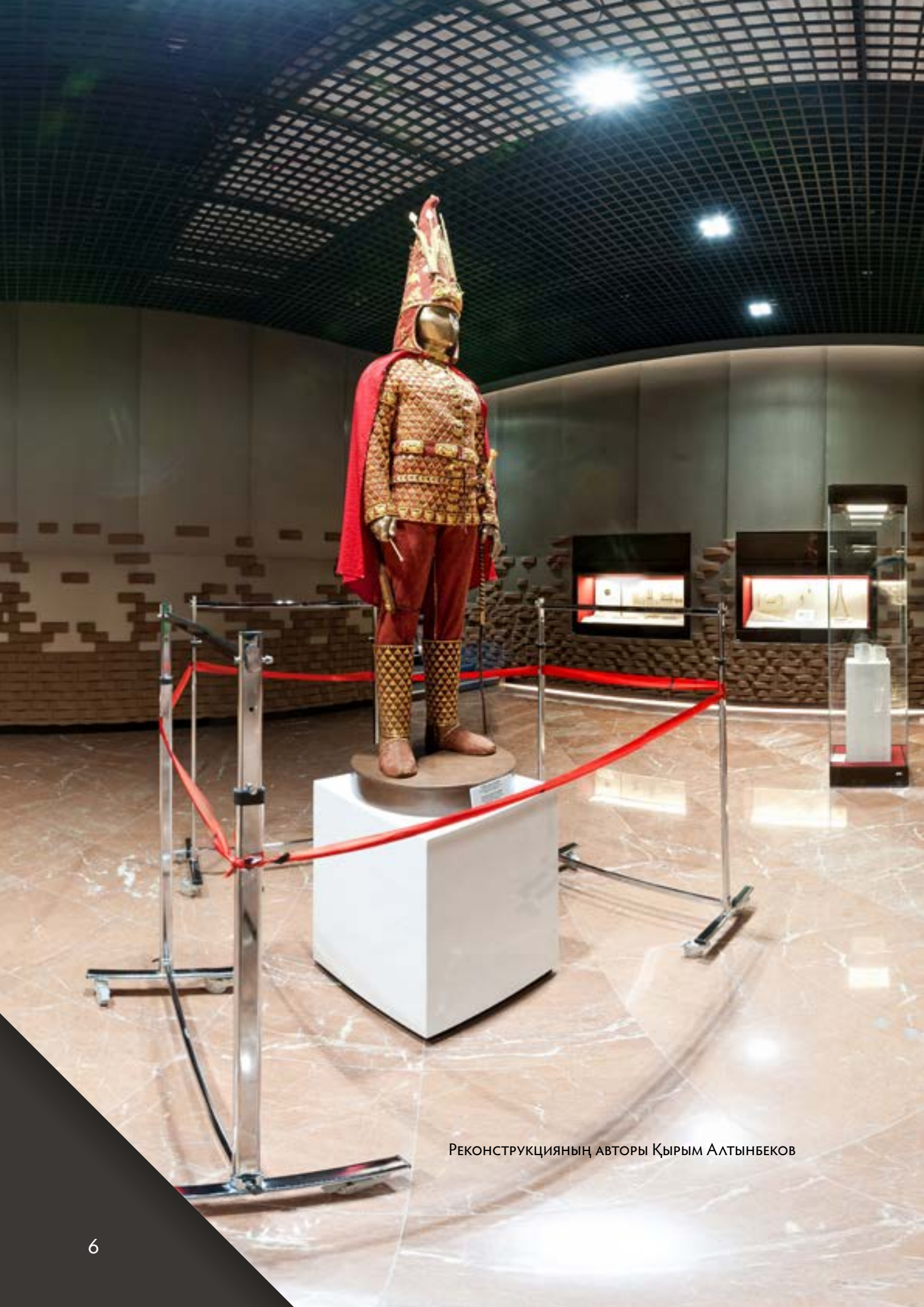
РЕКОНСТРУКЦИЯНЫҢ АВТОРЫ ҚЫРЫМ АЛТЫНБЕКОВ