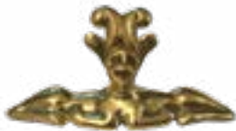
Екі жақты финкс, Берел қорғаны, Б.З.Д. IV-III ғғ., Шығыс Қазақстан 65x30x20