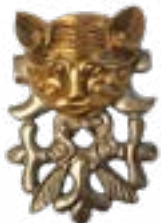
КОШАЧИЙ ХИЩНИК С ПРОТОМОЙ ДВУХ ЛОСЕЙ КУРГАН БЕРЕЛ, IV-III вв. до н.э., ВОСТОЧНЫЙ КАЗАХСТАН 95x68x23