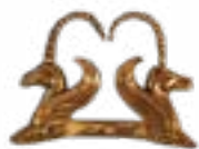
PROTOMA OF WINGED HORSES ISSYK MOUND (V-III CENTURIES B.C.) KAZAKHSTAN 160x110