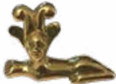
Солға қаратылған финкс, Берел қорғаны, Б.З.Д. IV-III ғғ., Шығыс Қазақстан 50x32x18