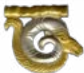
MOUNTAIN RAM BEREL MOUND (V-IV CENTURIES B.C.) KAZAKHSTAN 80x70