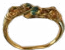
БРАСЛЕТ КУРГАННЫЙ КОМПЛЕКС ТАКСАЙ -1, V в. до н.э., Западный Казахстан 75x65x26