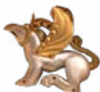
ТИГРОГРИФОН КУРГАН БЕРЕЛ, IV-III вв. до н.э., ВОСТОЧНЫЙ КАЗАХСТАН 350x300x120