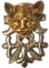
Екі бұланның басмүсіні бейнеленген мысықтұқымдас жыртқыш Берел қорғаны, Б.З.Д. IV-III ғғ. 95x68x23