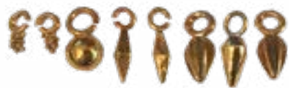
ПОДВЕСКИ ОТ СЕРЬГИ, V-III вв. до н.э., ЛЕБЕДЕВКА, ЗАПАДНЫЙ КАЗАХСТАН Общая площадь 40x35