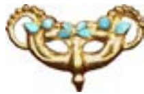
МАСКА БАРСА (ПРОТОМЫ ГОРНЫХ КОЗЛОВ С ПТИЦЕЙ) ШИЛИКТЫ (VII-VI вв. до н.э.) КАЗАХСТАН 27x15x5