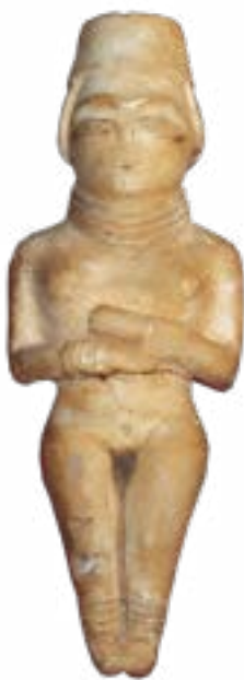
АНТРОПОМОРФНАЯ СТАТУЭТКА ИЗ АЛЕБАСТРА (КУРГАН У С. НИЖНЯЯ ПАВЛОВКА ОРЕНБУРГСКОГО РАЙОНА).

Цинк, алюминий, медный сплав. Длина 54,5 см. Ширина перекрестия 9,6 см.