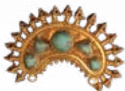
КОЛТЫ В ПОЛИХРОМНОМ СТИЛЕ, ЗЕРНЬ, ФИЛИГРАНЬ, ИНКРУСТАЦИЯ, СЕМИРЕЧЬЕ, III-V вв. н.э., МОГИЛЬНИК АКТАС 1, СЕМИРЕЧЬЕ 50x40