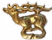
ЛЕТЯЩИЙ ОЛЕНЬ ЖАЛАУЛИНСКИЙ КЛАД (V-IV вв. до н.э.) КАЗАХСТАН 38x28x8