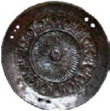
ДРЕВНЕИРАНСКИЙ ФИАЛ С РАСТИТЕЛЬНЫМ ОРНАМЕНТОМ ИЗ КУРГАНА У С. ПРОХОРОВКА В ШАРЛЫКСКОМ РАЙОНЕ.

Цинк, алюминий, медный сплав. Высота 7,8 см, диаметр венчика 4,2 см.