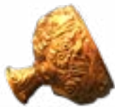
RITUAL QUEEN BOWL ARZHAN MOUND (VII-VIII CENTURIES B.C.) TUVA 42x42x37