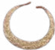
PECTORALE ARZHAN MOUND (VII-VIII CENTURIES B.C.) TUVA 160x132x10