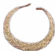
АЛҚА АРЖАН ҚОРҒАНЫ (Б.З.Д. VII-VIII ҒҒ.) ТУВА 160x132x10