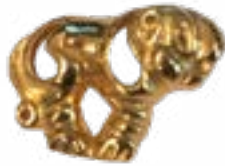
Оңға қаратылған жолбарыс түріндегі түйіндік Талды-2, Б.З.Д. VI-V ғғ. Қазақстан 23x17x7