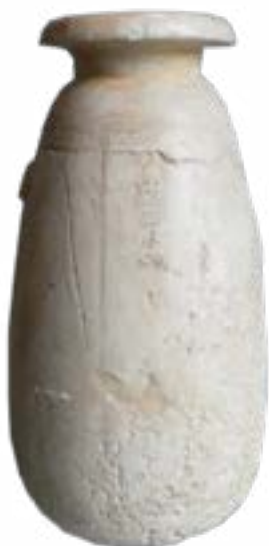
ЕЖЕЛГІ МЫСЫРЛЫҚ ҮДЫС (АЛЕБАСТР) (ЖАҢА КУМАК ҚОРЫМЫНЫҢ ҚОРҒАНЫНАН).