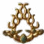
ДВОЙНОЙ ОЛЕНЬ ШИЛИКТЫ (VII-VI вв. до н.э.) КАЗАХСТАН 28x16x5