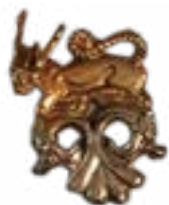
MYTHICAL ANIMAL BEREL MOUND (IV-III CENTURIES B.C.) KAZAKHSTAN 70x90, H-45