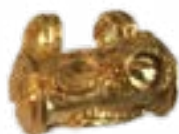
ПОДВЕСКА СЕМИРЕЧЬЕ, КАРГАЛИНСКИЙ КЛАД, II-I вв. до н.э. 18x14