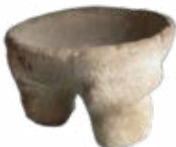
ЗООМОРФТЫ ҚҰРБАНДЫҚ ШАЛАТЫН ҮДЫС, (ЧКАЛОВ ҚОРЫМЫНАН АЛЫНҒАН) ҰСАҚ ТҮЙІРЛІ ҚҰМДАҚ.