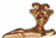
SPHINX BEREL MOUND (V-IV CENTURIES B.C.) KAZAKHSTAN 50x32x18