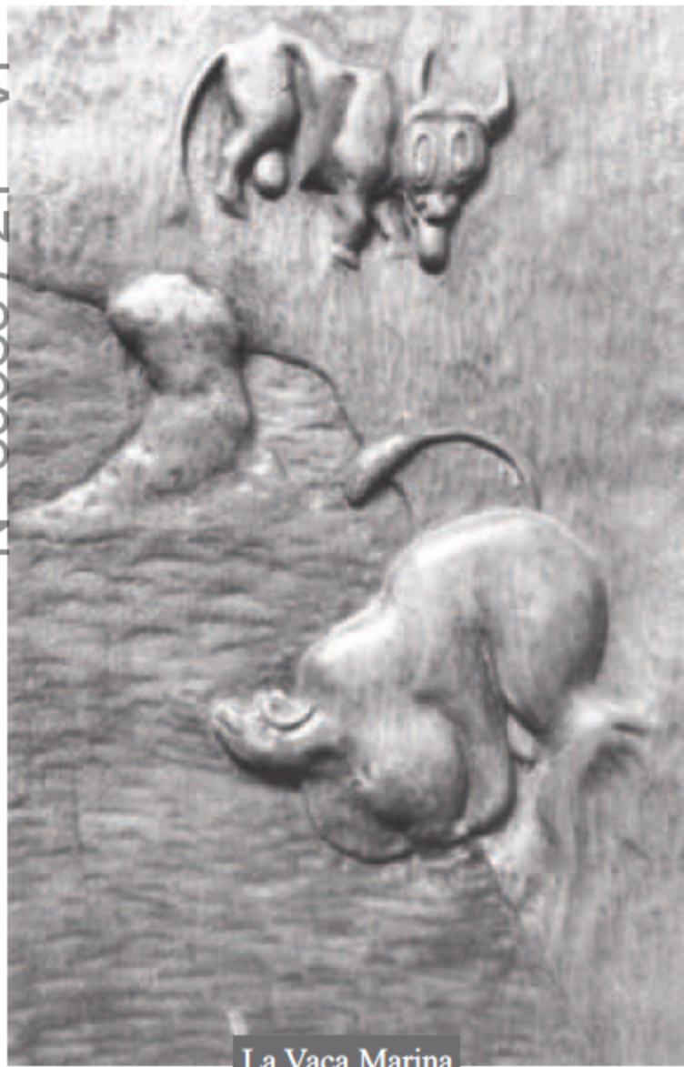
La Vaca Marina