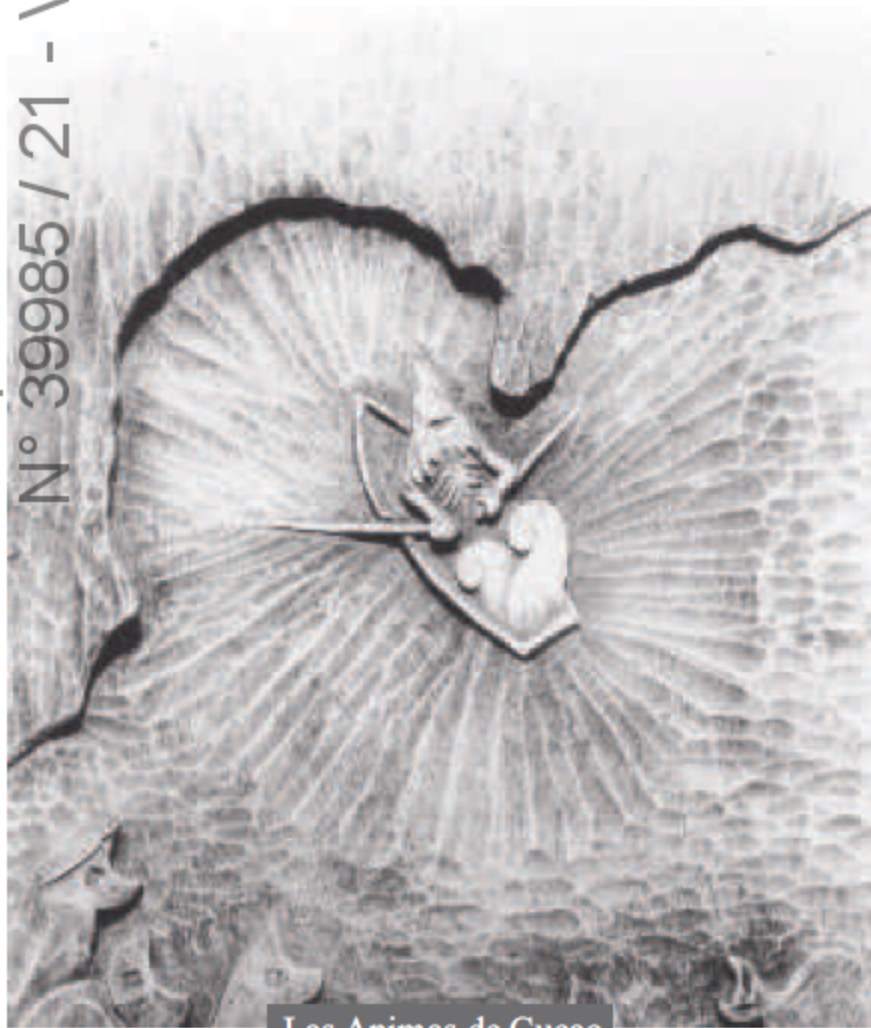
Las Animas de Cucao