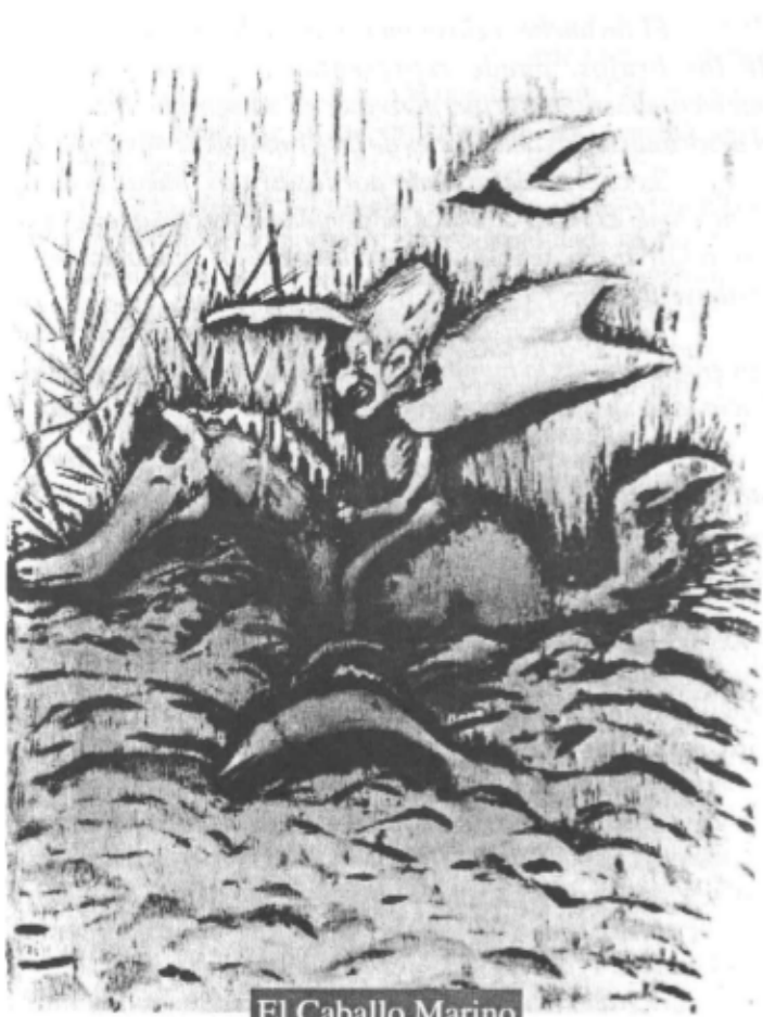
El Caballo Marino

Propiedad Intelectual: N° 39985 / 21 - VI - 72