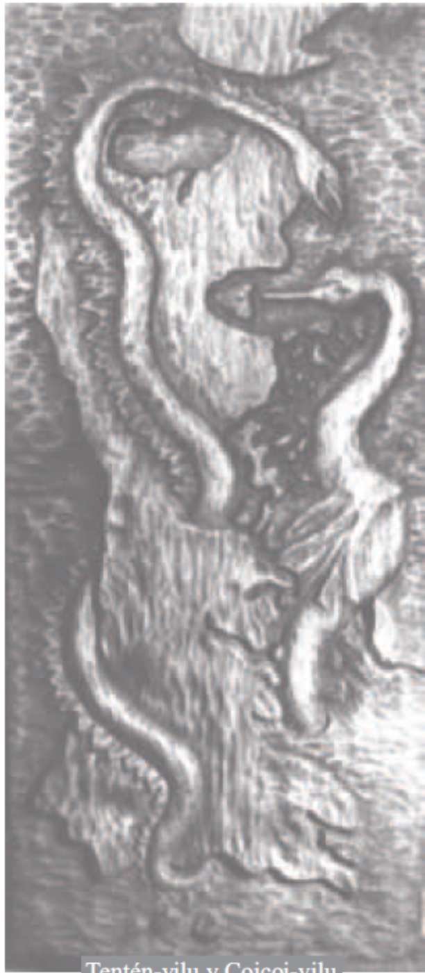
Tentén-vilu y Coicoi-vilu

Propiedad Intelectual: N° 39985 / 21 - VI - 72