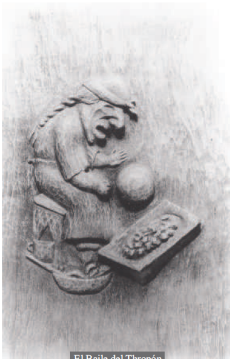
El Baile del Thropón

Propiedad Intelectual: N° 39985 / 21 - VI - 72