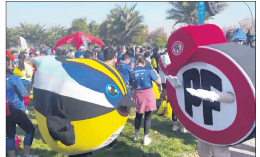
El Señor PF puso a prueba al pájaro de siete colores.