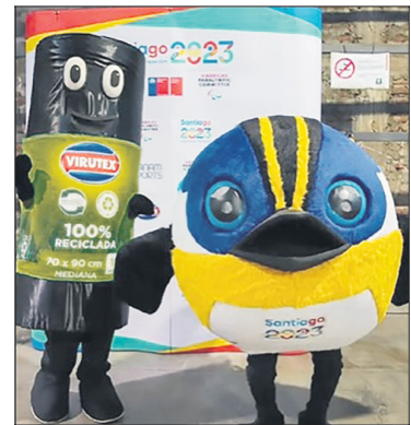
Basurín fue el primero que se unió a Fiu.