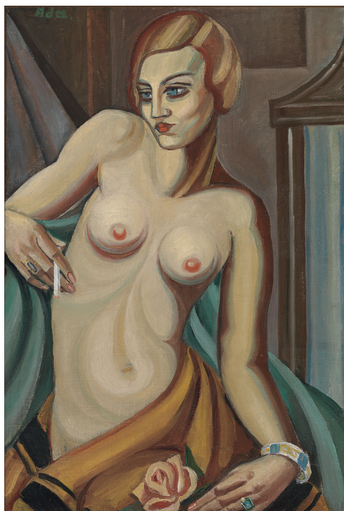
„Moteris su cigarete“. 1934 m.

Drobė, aliejus, 82 × 55 cm. Rolando Valiūno nuosavybė.