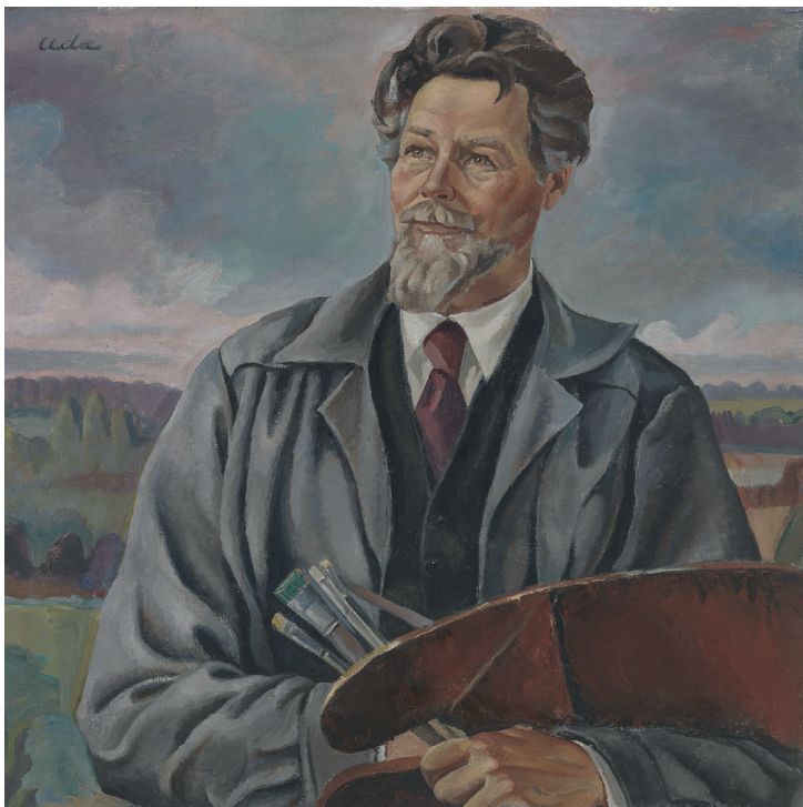
„Antano Žmuidzinavičiaus portretas“. 1939 m.

Drobė, aliejus, 88 × 88 cm. Nacionalinio M. K. Čiurlionio dailės muziejaus A. Žmuidzinavičiaus kūrinių ir rinkinių archyvas, ŽR-649.