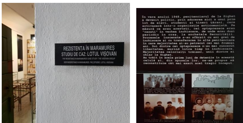
Membri ai „lotului Vișovan” la 50 de ani de la data încarcerării, fotografiați împreună cu membri ai familiei chiar în încăperea în care au fost deținuți (28 august 1998).

foarte buni la învățătură și cu un comportament foarte serios în școală și societate. La ședințele Frăției de Cruce se citea și medita Evanghelia, se punea accent pe rugăciune și post, prezența obligatorie la liturghie în duminici și sărbători, recunoașterea și repararea greșelilor comise în timpul săptămânii, solidaritatea deplină a camarazilor, simțul responsabilității precum și îmbunătățirea rezultatelor la școală, cultivarea spiritului gospodăresc și altele. Ca un exemplu remarcabil al educației din Frățiile de Cruce îl constituie studentul basarabean Valeriu Gafencu, cunoscut azi sub numele de „sfântul închisorilor”, mort aureolat de sfințenie în închisoarea Tg. Ocna în 1952. În 1940 Valeriu Gafencu fusese îndrumătorul Frățiilor de Cruce de la liceele din Iași.