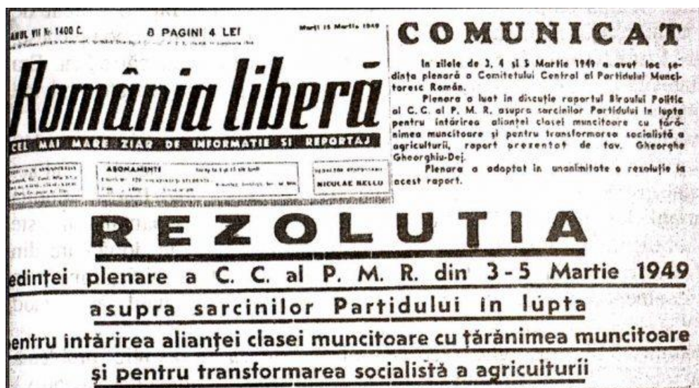
Fig. 2: Anunțul din presă pentru colectivizarea agriculturii.

Au fost expropriate atât pământul, cât și inventarul viu, instalațiile agricole, produsele agricole, creanțele, titlurile și participările decurgând din activitatea exploatărilor moșierești. Opoziția față de confiscare sau tănuirea bunurilor se pedepseau cu 5-15 ani de muncă silnică și confiscarea averii (Tismăneanu V., p. 428). Orice forme de împotrivire la colectivizare, de cele mai multe ori, au dus la arestări, deportări sau omoruri.