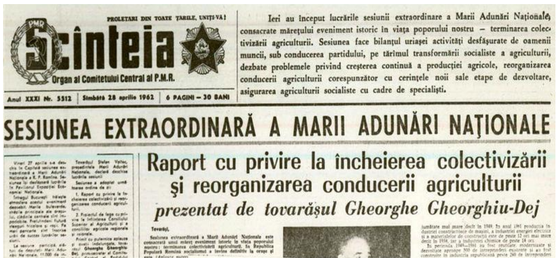
Fig. 3: Anunțul din ziarul Scînteia privind încheierea colectivizării agriculturii. Sursa: http://fototeca.iicr.ro/picdetails.php?picid=42770X86X94

La sesiunea extraordinară a Marii Adunări Naționale din zilele de 27 și 28 aprilie 1962, Gheorghiu-Dej a anunțat încheierea transformării socialiste a agriculturii (fig. 3): „ In Republica Populară Română, socialismul a învins definitiv la orașe și sate... Sectorul socialist din agricultură deține astăzi 96% % din suprafața arabilă și 93.4% din suprafața agricolă a țării; gospodăriile colective cuprind 3 201 000 de familii, aproape totalitatea familiilor țărănești... ” (Gheorghiu-Dej Gh., 1962, p. 287).