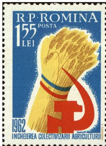
Fig. 5: Timbru emis în 1962 care anunță încheierea colectivizării agriculturii.