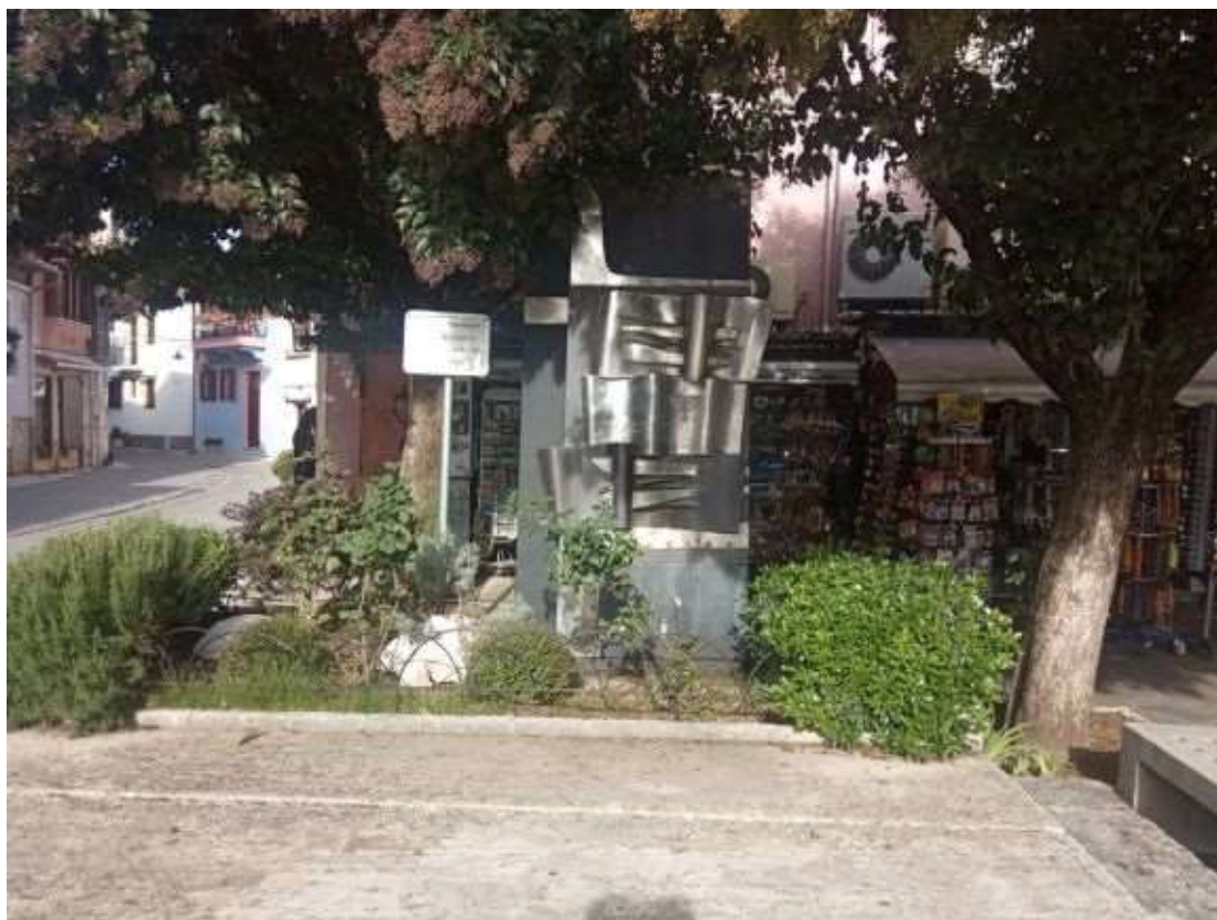
Φωτογραφία του μνημείου

https://www.digitalglyptotheque.gr/greece_exhibits/%CF%84%CE%BF-%CE%BC%CE%BD%CE%B7%CE%BC%CE%B5%CE%AF%CE%BF-%CF%84%CF%89%CE%BD-%CE%B3%CE%B9%CE%B1%CE%BD%CE%BD%CE%B9%CF%89%CF%84%CF%8E%CE%B D-%CE%B5%CE%B2%CF%81%CE%B1%CE%AF%CF%89%CE%BD/