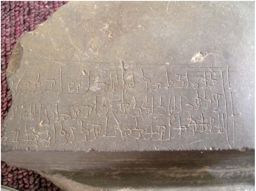
النقش هكر ١