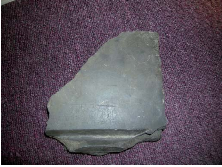
النقش هكر ١