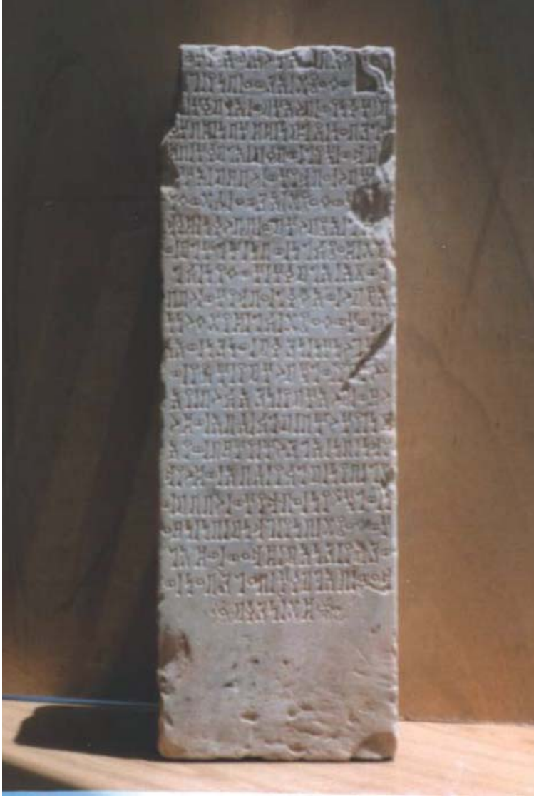
النقش متحف ذمار ٢٠٨