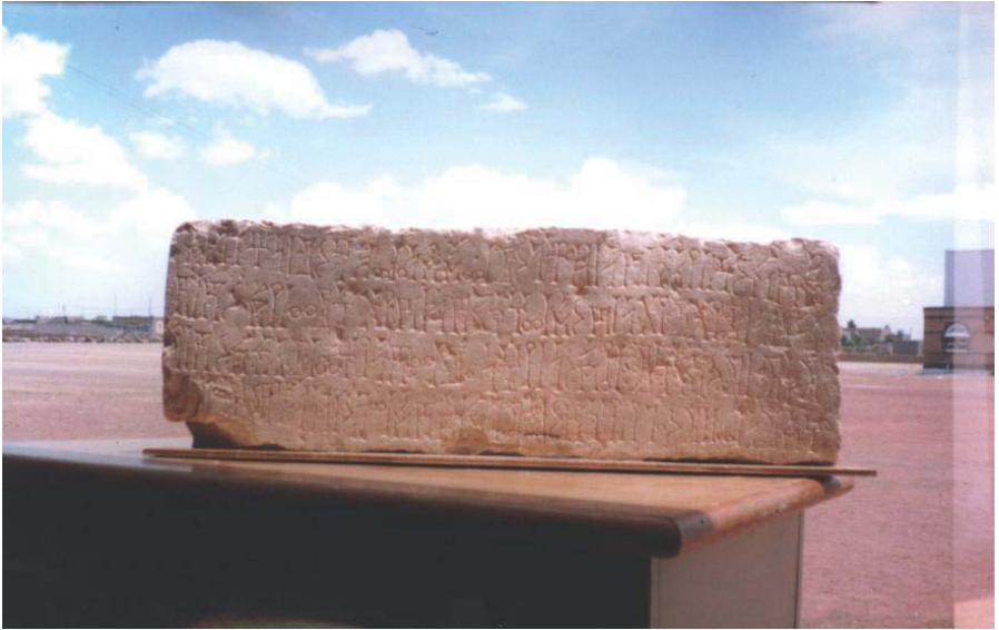
النقش متحف ذمار ٢٠٤