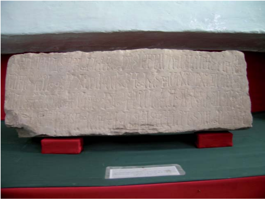
النقش متحف ذمار ٢٠٤