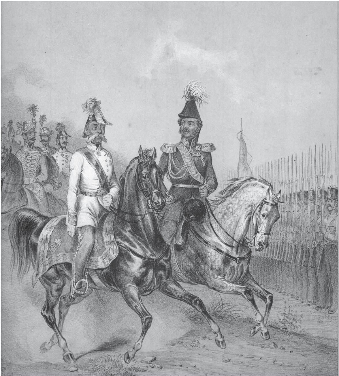
Haynau cs. kir. táborszernagy és Paszkevics orosz tábornagy