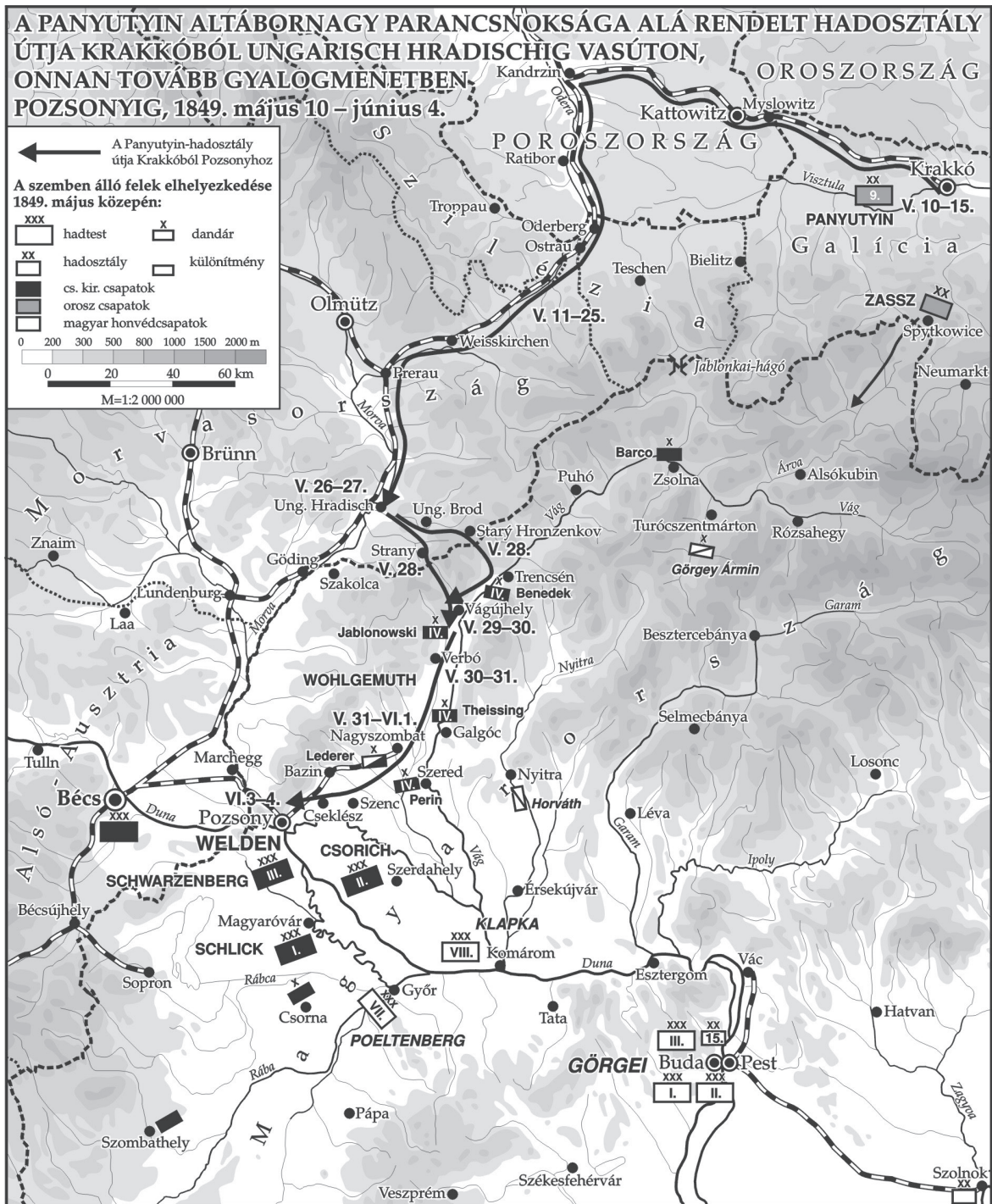
1. A Panyutyin altábornagy parancsnoksága alá rendelt hadosztály útja Krakkóból Ungarisch Hradischig vasúton, onnan tovább gyalogmenethen Pozsonyig, 1849. május 10 – június 4.