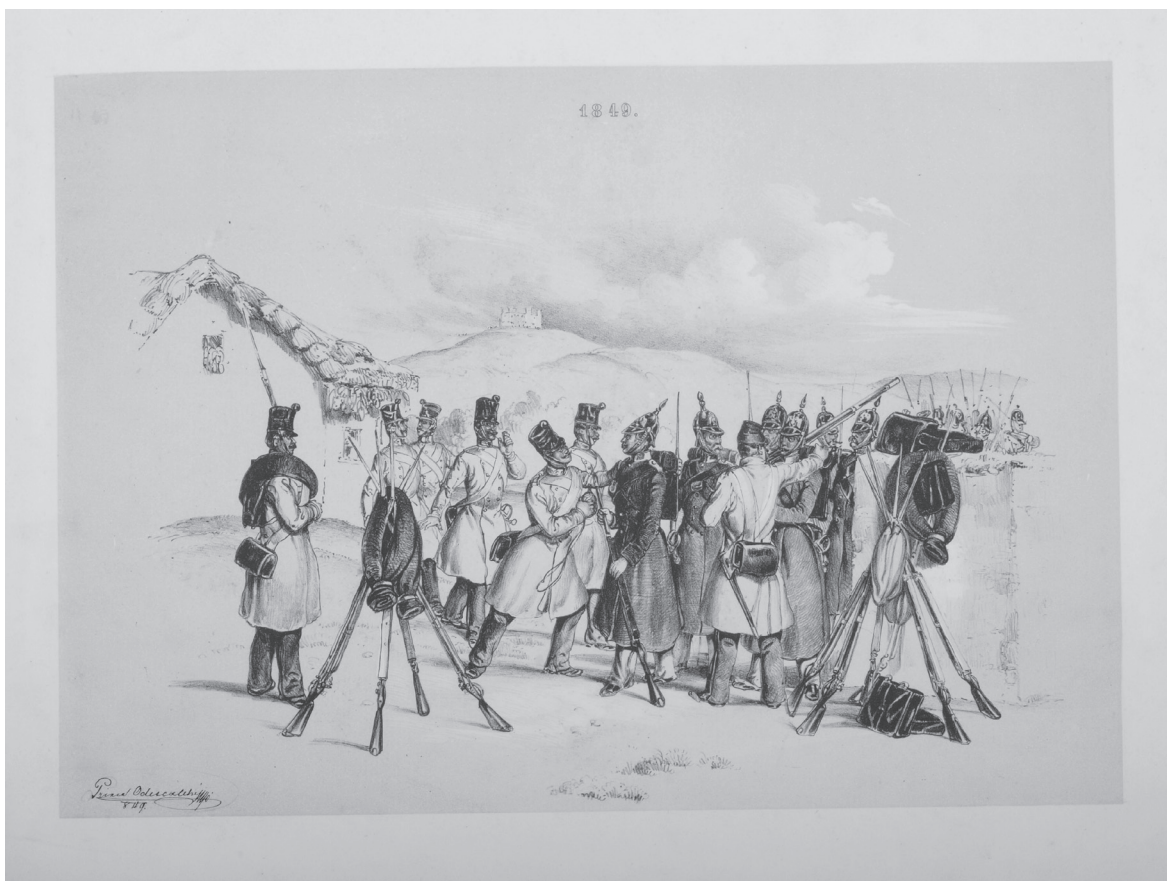
Császári és orosz gyalogosok barátkoznak Pozsony környékén (V. Odescalchi rajza, Hermann Róbert gyűjteményéből)