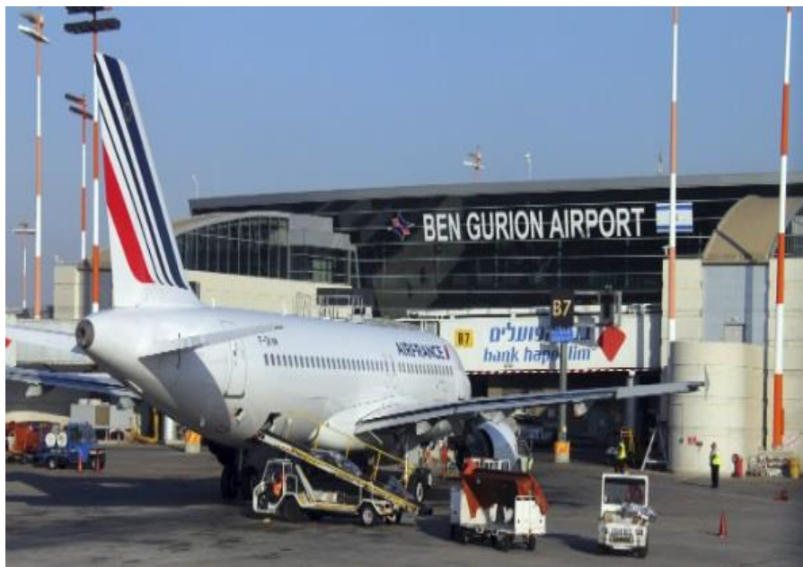
本·古里安国际机场

北京—特拉维夫、上海—特拉维夫、成都—特拉维夫和深圳—特拉维夫的直飞航线已分别于2016年4月、2017年9月2018年9月和2019年2月正式开通。