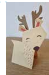
Atelier Origami : création hivernale