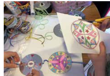
Mandala à souhait pour 2024

Par Mandala Mass'. Dès 3 ans avec accompagnateur. Entrée libre. Taverne de Givrou, place Georges-Corbis, de 14 h 30 à 17 h 30