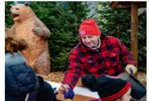
La Cabane à sucre canadienne

Tarif unique : 2 €. Dès 12 ans. Patinoire Christian-Ochem, parc des loisirs, 20 h 30 à 23 h