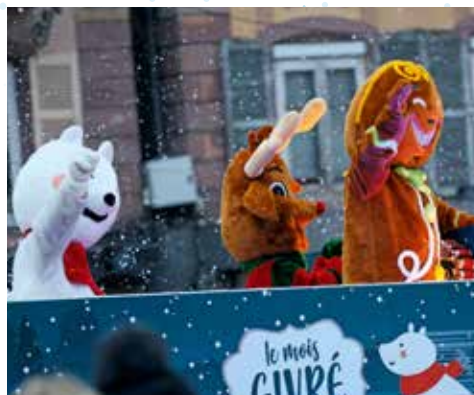
La Parade de Givrou