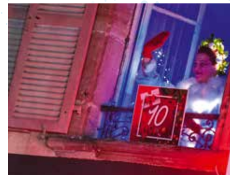
La Fenêtre de Noël