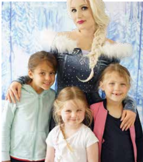
Rencontre-photo avec la Princesse des Neiges

Au programme spectacle pour enfants suivi d'un goûter en présence de Givrou. Dès 3 ans avec accompagnateur. Entrée libre. Maison de quartier municipale de la Vieille-Ville, 3, rue des Boucheries, de 15 h 30 à 16 h 30