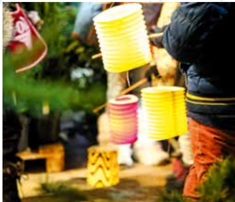
Les lumières de Noël : fabrication d'un lampion portatif