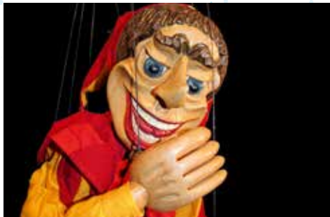
Visite commentée de l'exposition « un tour du monde de la marionnette »