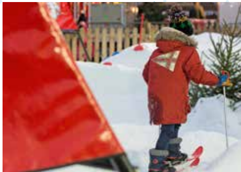
Initiation au ski