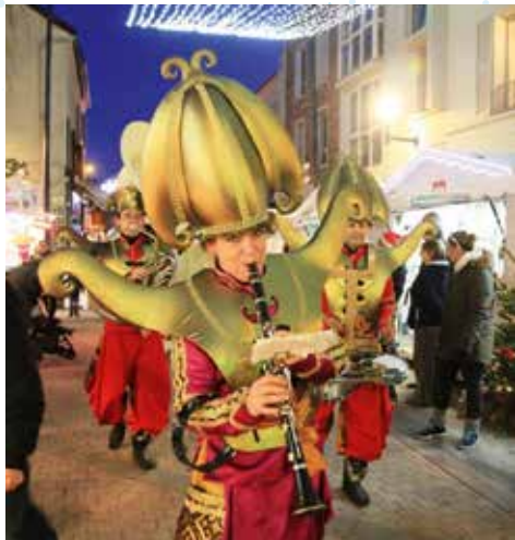
Déambulation de la fanfare Mamamouchis