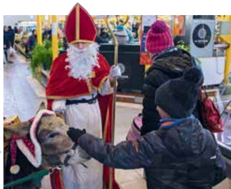
Distribution de Jean Bonhommes

À partir de 7 ans. Entrée libre. Sur réservation : 03 84 54 25 89. Bibliothèque municipale Léon-Deubel, place Jacques-Chirac, à 15 h