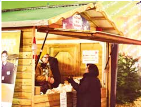
Le Chalet de la solidarité