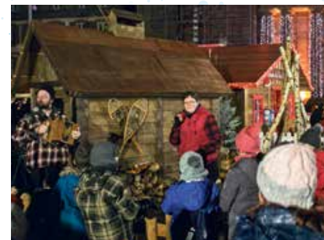
Un jour, un conte

L'association vous présente ses activités, recrute des bénévoles et collecte des fonds pour financer ses actions. Le Chalet de la solidarité, place Georges-Corbis - côté patinoire, de 10 h à 20 h