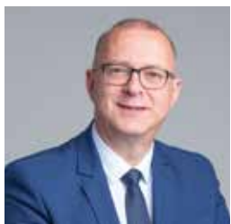
Damien MESLOT Maire de Belfort