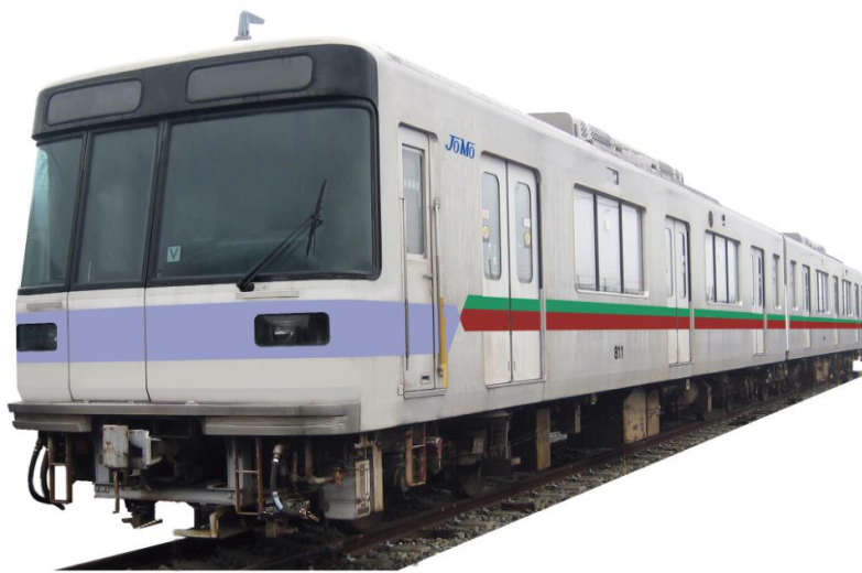
新型車両イメージ