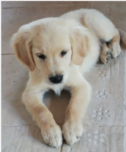
▲ 1. místo: Dino

Z náme nejsympatičtějšího zvířecího rošťáka Třince roku 2019! Z více než čtyřicítky přihlášených domácích mazlíčků, mezi nimiž nechyběli psi, kočky, morčata, králíci, kůň, a dokonce i koza, zvítězilo v letošním ročníku fotosoutěže štěně zlatého retrívra Dino. Psí rošťáci ovládli v anketě i další dvě místa.