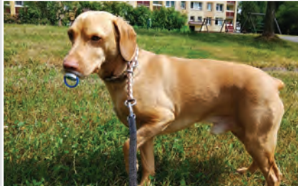
▲ 2. místo: Maňa

Z náme nejsympatičtějšího zvířecího rošťáka Třince roku 2019! Z více než čtyřicítky přihlášených domácích mazlíčků, mezi nimiž nechyběli psi, kočky, morčata, králíci, kůň, a dokonce i koza, zvítězilo v letošním ročníku fotosoutěže štěně zlatého retrívra Dino. Psí rošťáci ovládli v anketě i další dvě místa.