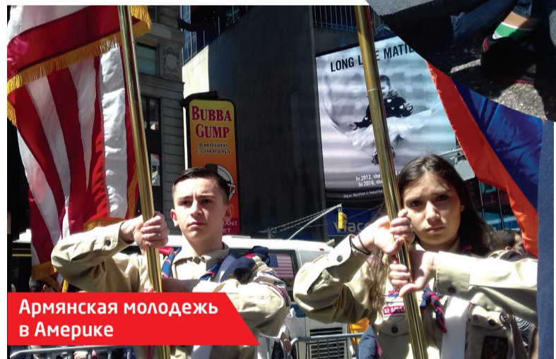
Армянская молодежь в Америке

баксов поужинал в его же ресторане и 5 «зеленых» оставил на чай милой официантке. Итого — 50 долларов на карман кандидату. Глядишь, станет президентом США и вспомнит о моей финансовой поддержке.