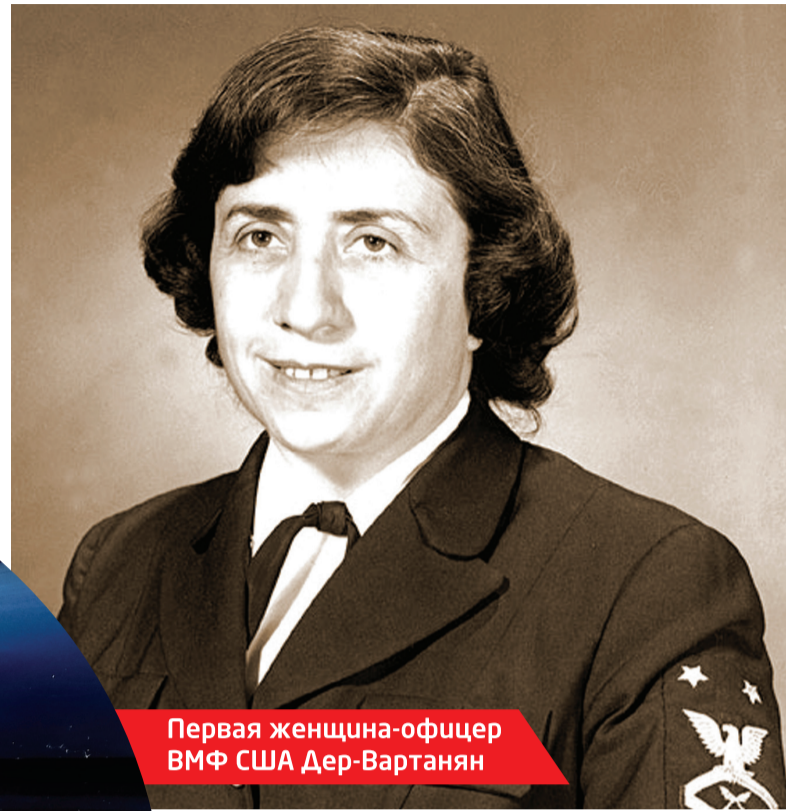
Первая женщина-офицер ВМФ США Дер-Вартанян

В 50-е годы армяне, как и большинство захиточных ньюйоркцев, стали покидать Манхэттен. Многие из них переехали в соседний штат Нью-Джерси и на Лонг-Айленд. Манхэттен постепенно стали заселять индейцы и латиноамериканцы.