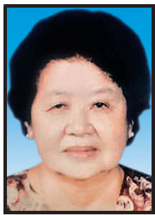
夫人, 于 2023