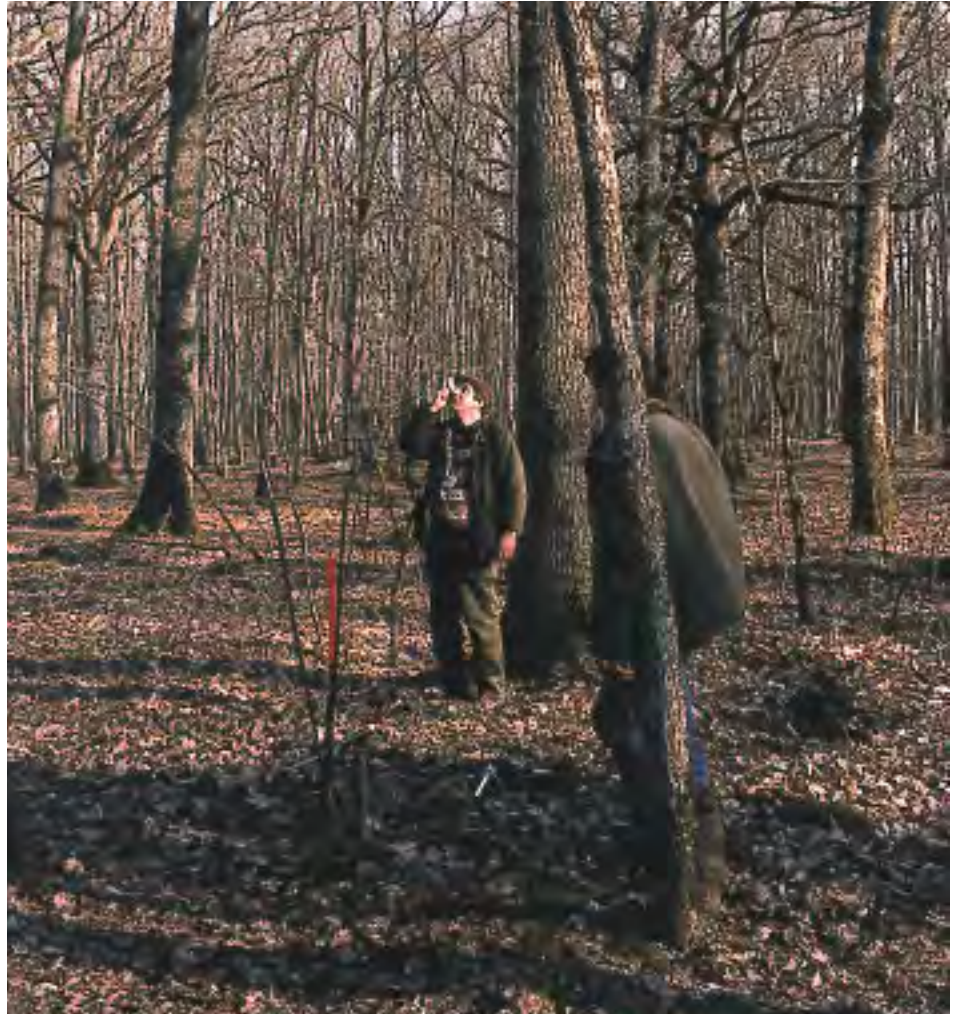
Mesure de la hauteur au dendromètre.